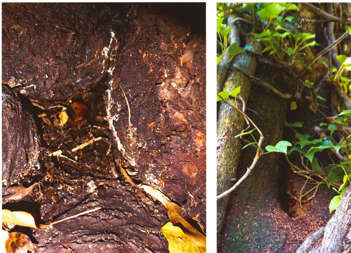
Fig. 3. Exemples de cavités présentes sur le cerisier dans le verger haute-tige de Meinier où la larve de C. aurata s'est sans doute développée. Les traces blanches dans la cavité de gauche, des moisissures, témoignent de la présence passée d'eau dans la cavité.

abordées dans cette note, leur répartition en Suisse demeure donc méconnue. A l'avenir, des recherches ciblées pourraient permettre de mieux appréhender leur distribution ainsi que de peut-être découvrir la présence d'autres espèces du genre Callicera en Suisse, toutes présentes en régions limitrophes (France, Allemagne, Italie): C. fagesii , C. marcquarti , C. rufa et C. spinolae (Speight 2015).