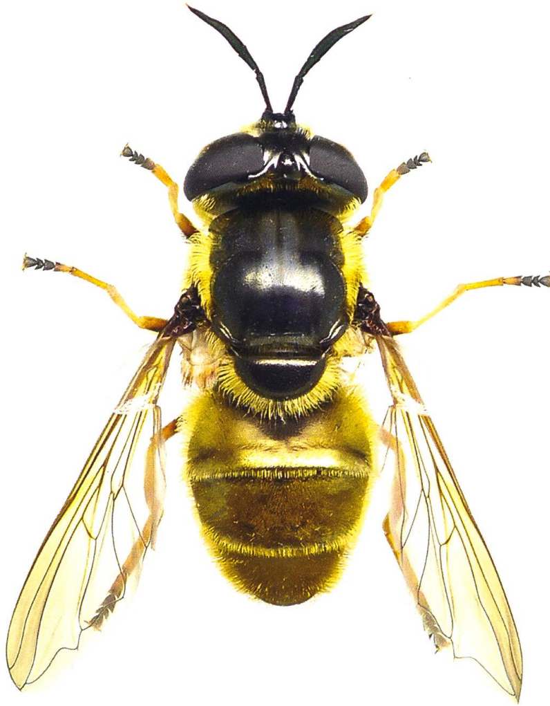
Fig. 1. Habitus de la femelle de Callicera aurata . Les deux bandes de pruinosité blanches qui s'arrêtent au milieu du thorax et les tarsi 2–4 noircis sont bien visibles et sont typiques de cette espèce.

C. aurata est généralement associée à la présence d'arbres âgés ou sénescents disposant de cavités remplies d'eau et de débris en putréfaction où la larve se développe lentement (> 1 an) en se nourrissant de micro-organismes (Rotheray 1991). La larve a déjà été extraite de cavités présentes sur les essences suivantes: Fagus (Rotheray 1991, Dussaix 2005), Quercus (Dussaix 2005), Fraxinus (Ricarte 2008) et Betula (Perry 1997). Dès la fin du mois de mai, les adultes volent au-dessus de la canopée et descendent occasionnellement pour se nourrir sur des fleurs ou pour s'abreuver à proximité d'un ruisseau (Speight 2015). Les femelles, moins sédentaires que les mâles, peuvent être trouvées à une grande distance (quelques centaines de mètres) de la forêt, elles ont déjà été observées sur les genres ou les espèces de plantes suivantes: Crataegus , Calluna , Dipsacus fullonum , Filipendula , Hedera helix , Rosa , Hypericum , Rubus fruticosus , Succisa pratensis et Verbascum (Speight 2015).