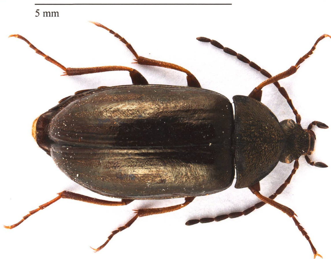
Fig. 1. Habitus de l'individu suisse d' Isomira costessii capturé en 2016 (6,6 mm).

Toutes les espèces d' Isomira citées, qu'elles aient été retenues ou non, font partie du sous-genre nominal (Novák & Pettersson 2008) alors qu'aucune espèce du sous-genre Heteromira Hölzel, 1958 n'était connue de Suisse. La capture d'un spécimen d' Isomira ( Heteromira ) costessii (Bertolini, 1868) en 2016 en Engadine constitue donc la première preuve de présence de ce sous-genre, et donc de cette espèce, dans notre pays. Cette découverte est présentée et mise en perspective avec les autres observations européennes connues.