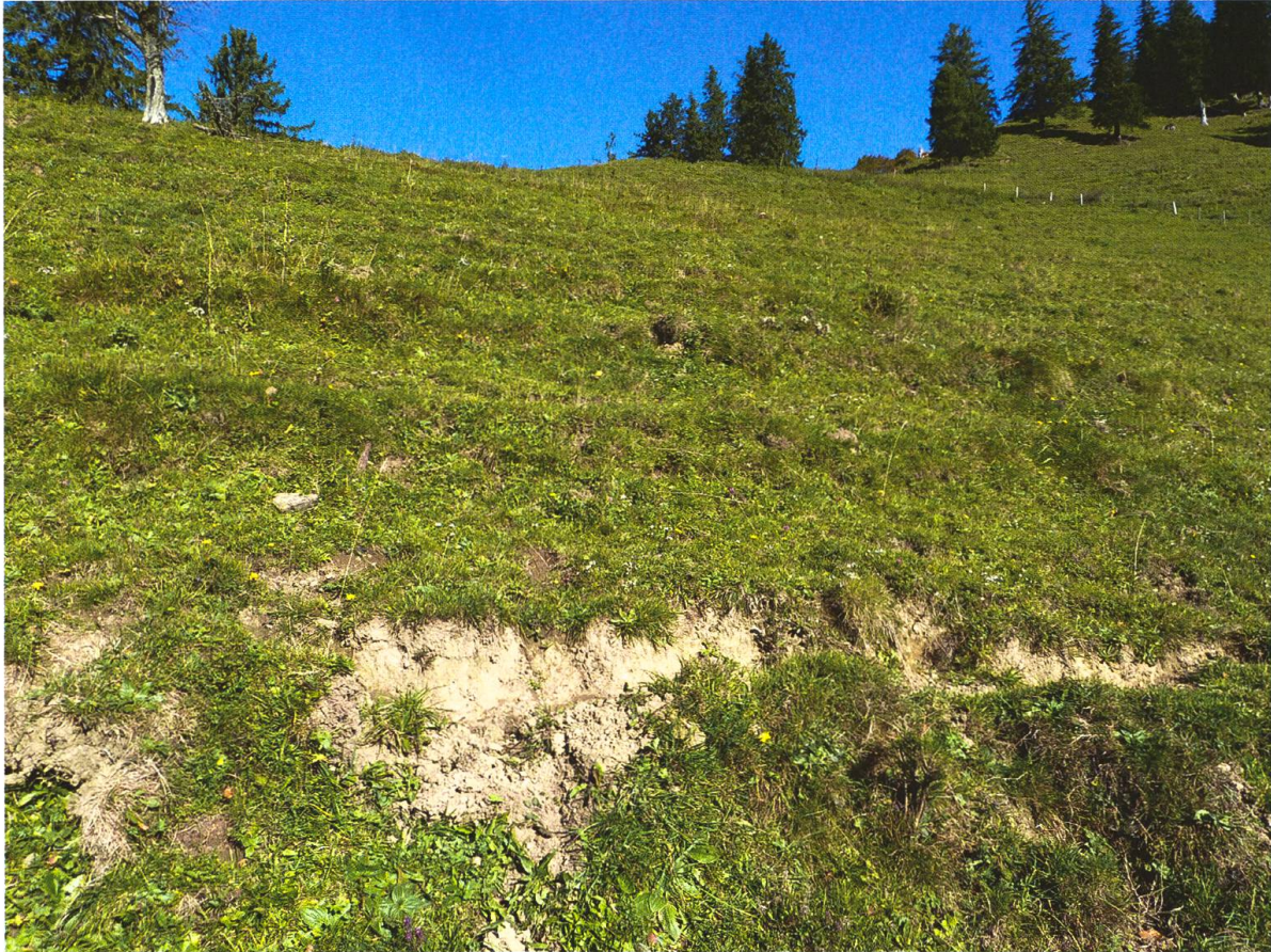
Abb. 2. Fundort von Phengaris (Maculinea) arion (Linnaeus, 1758) auf einer Extensivweide unterhalb des Schnebelhorns (Fischenthal, ZH) auf 1150 m ü. M.

1150 m ü. M. nachweisen (Abb. 1). Das Individuum wurde auf einer extensiv genutzten, südostexponierten, relativ steilen Weide aus der Luft gekeschert. Die Weide zeichnet sich durch Viehweglein und offene Bodenstellen aus (Abb. 2) und war 2016 mit Rindern und Ziegen bestossen. Zahlreiche Pflanzenarten (z. B. Achillea millefolium , Carduus defloratus , Carlina acaulis , Euphrasia rostkoviana , Gentiana verna , Hieracium pilosella , Knautia arvensis , Ononis repens , Plantago media , Thymus pulegioides ) weisen gemäss Zeigerwerten von Landolt et al. (2010) auf eine starke Sonneneinstrahlung und/ oder nährstoffarme Verhältnisse hin.