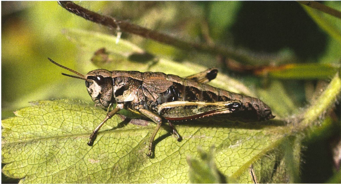
Fig. 2. Femelle de Podismopsis sp. observée à Planplatten – Gummenhubel, Hasliberg (BE), le 14.09.2016.