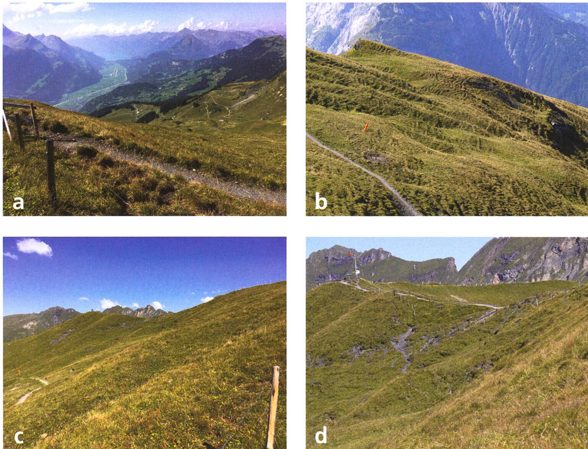
Fig. 4. Vues sur le milieu (principalement Nardion pâturé) dans lequel la population de près de 100 individus de Podismopsis sp. a été observée les 14 et 15.09.2016 le long de la crête sommitale entre Planplatten et Gummenhubel (2170–2240 m) à Hasliberg. a : vue à l'ouest sur le Lac de Brienz, b : vue au sud-ouest; c, d : vue au nord en direction de l'Alpen Tower. Les pylônes avec le drapeau orange correspondent à l'espace de décollage des parapentistes.

l'Oberland bernois. Cette observation effectuée à plus de 100 km à vol d'oiseau de la population de Podismopsis la plus proche, dans les Churfisten, a incité à entreprendre une inspection approfondie du site pour rechercher d'éventuels autres individus.