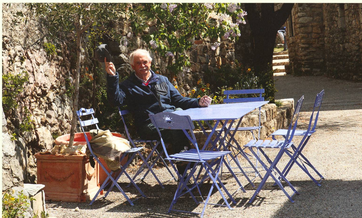
Südfrankreich-Reise, Bargème/Var, 22.4.2011.