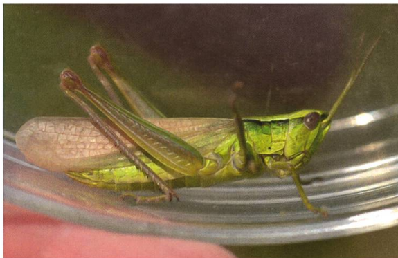
Abb. 4. Langflügliges Weibchen von Euthystira brachyptera , gefangen im Flug am 22. Juni 2017 auf dem Bettlachstock.

Flugaktivität an Intensität zugelegt, tauchten die ersten Beutegreifer auf. Wohl aus der Aareebene kommend, versammelten sich nach und nach bis zu 14 Milane, grösstenteils Schwarzmilane, darunter auch wenige Rotmilane. Dies ist eine beachtliche Ansammlung für Milane auf einer Höhe von über 1200 mü.M. während der Brutzeit. Neunmal konnte ich deutlich beobachten, wie Goldschrecken im Flug erbeutet wurden, achtmal vom Schwarzmilan und einmal von einem Buchfink. Einigen E. brachyptera gelang es, mit Unterstützung des Windes nach Osten wegzufiegen, hauptsächlich zu Beginn der Flugaktivität, als noch keine Milane anwesend waren. Der Anzahl Angriffe der Milane zufolge müssen noch viel mehr fliegende E. brachyptera in der Luft gewesen sein als ich erfassen konnte, ausser die Milane erbeuteten noch andere Insekten, wofür ich aber keinen Hinweis fand. Angriffe wurden nur von Schwarzmilanen festgestellt, die Rotmilane verhielten sich passiv.