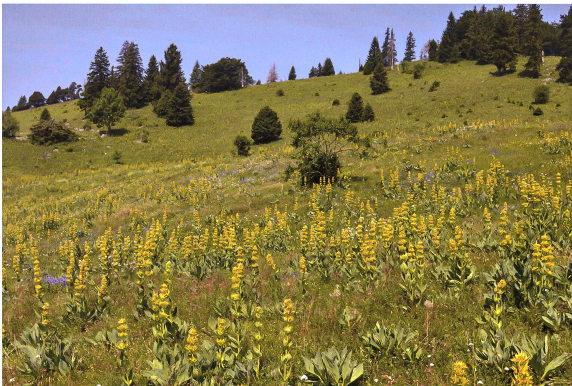
Abb. 1. Lebensraum von Euthystira brachyptera auf dem Bettlachstock. Aufgegebene Wiese mit viel Gelbem Enzian ( Gentiana lutea L.), 22. Juni 2017, Blick nach Nordwesten.

Der Bettlachstock liegt zwischen Biel und Solothurn in der Gemeinde Bettlach (SO) und gehört zur ersten Jurakette. Er ist kantonales Naturreservat. Ca. 103 ha davon sind Wald, welcher nicht mehr genutzt wird, und zuoberst, im Höhenbereich von 1220 bis 1300 m.ü.M. liegt eine südexponierte, offene, ehemalige Landwirtschaftsfläche mit einer Grösse von einigen Hektaren (Abb. 1). Hier wurde noch bis Ende des letzten Jahrhunderts an den flacheren Stellen Ackerbau betrieben. Spätestens 1992 wurden diese in Mähwiesen umgewandelt. Die steilen Passagen dienten der Sömmerungsweide. Eine Nutzung fand bis 2001 statt (T. Schwaller pers. Mitt.). Seither ist das Gebiet der natürlichen Sukzession preisgegeben. Bisher ist glücklicherweise noch kein grösseres Aufkommen von Büschen und Bäumen zu beobachten. Die Vegetation ist an vielen Stellen verfilzt, was das Aufkommen von Gehölz erschwert. Vielleicht wird die Verbuschung