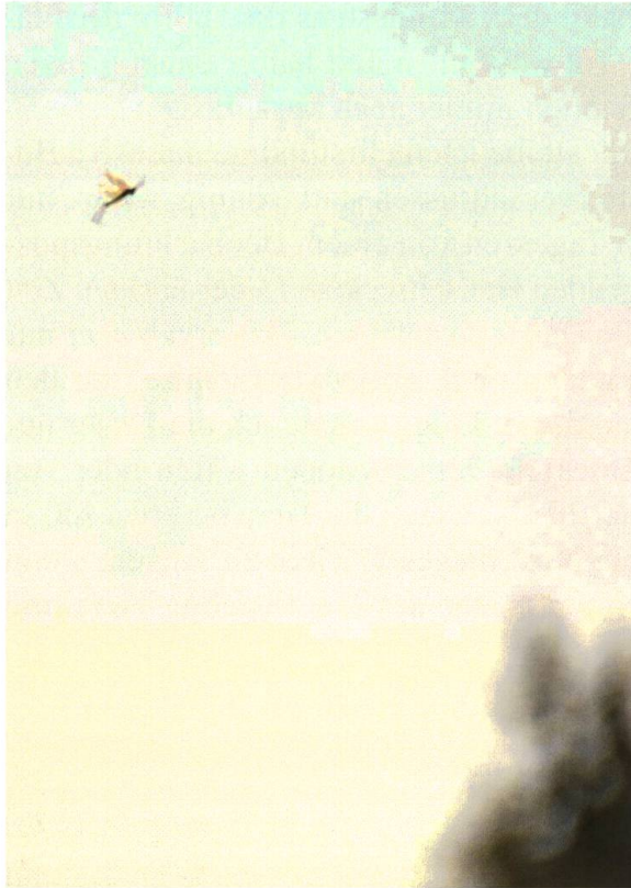
Abb. 3. Fliegende Euthystira brachyptera . Bettlachstock, 22. Juni 2017. Man beachte die typischerweise schräg nach hinten herabhängenden Hinterbeine.