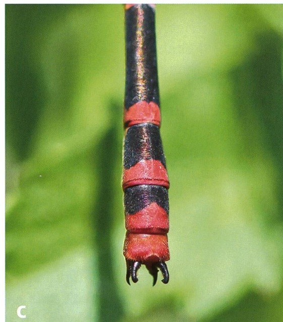
Abb. 2. Pyrrhosoma elisabethae. a) Männchen, b) Porträt Männchen, c) Hinterleibsende des Männchens mit den arttypischen oberen und unteren Anhängen. Beim Männchen von Pyrrhosoma elisabethae ist der hakenförmige Fortsatz auf der Unterseite der oberen Hinterleibsanhänge nur ein Drittel so lang wie die oberen Anhänge selbst. Zudem sind die unteren Anhänge etwas länger als die oberen.