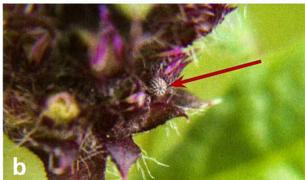
Abb. 2. a) Ei von Carcharodus floccifera im Blütenstand von Stachys officinalis . b) Nahaufnahme eines Eies.

Blattrosetten deutlich bevorzugt, es werden jedoch auch vereinzelt blühende Pflanzen mit Eiern versehen.» Als selten wird die Eiablage auf der Blüte beschrieben: «Ganz aus dem Rahmen fällt die am 12.7.1997 im Gebiet 9 festgestellte Ablage an einen jungen Blütenstand von Betonica officinalis ( Stachys officinalis ). Dabei brachte das Weibchen das Ei in ca. 25 cm Höhe ab Boden zwischen Blütenknospen an den Kelch an.»