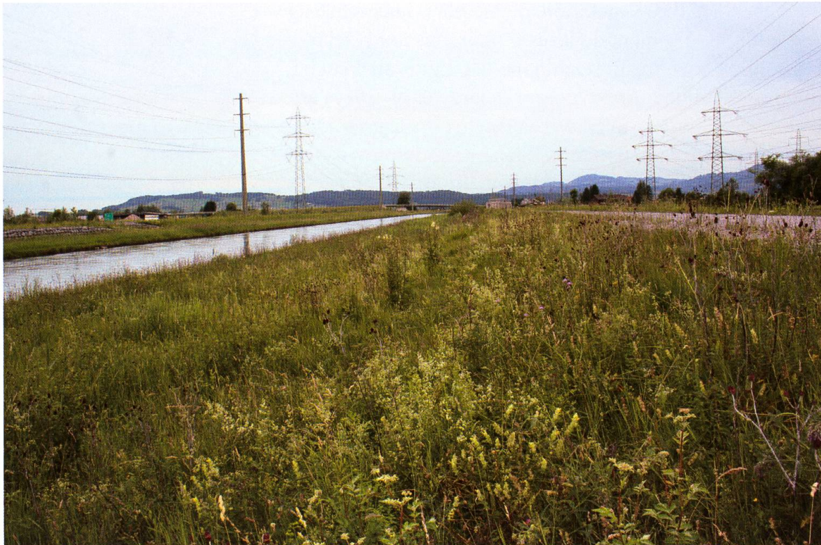
Abb. 5. Rechtes Linth-Ufer bei Schänis. Sowohl in der Böschung (rechts im Bild) als auch im flachen Bereich mit dichter Vegetation (links im Bild), wurden Eier von Carcharodus floccifera auf Blütenköpfen von Stachys officinalis nachgewiesen.

Population am Linthkanal darstellt. Die Anzahl Eifunde auf den Blüten macht mit ungefähr einem Drittel einen hohen Anteil aus.