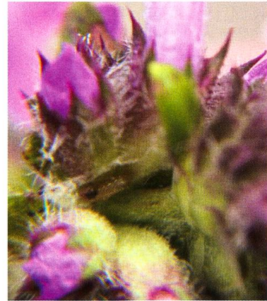
Abb. 3. Stachys officinalis mit einer Raupe von Carcharodus floccifera im Blütenkopf.

Es ist nicht auszuschliessen, dass das ortsspezifische Klima der Linthebene, das Mahdregime und die daraus resultierende Vegetationsstruktur die Eiablage des Falters an den Blüten begünstigen. Hingegen unwahrscheinlich ist, dass unsere Beobachtung eine Ausnahme für die