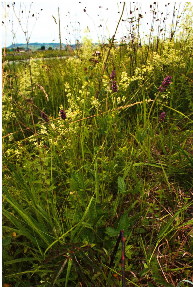
Abb. 4. Stachys officinalis mit sechs auf den Rosettenblättern abgelegten Eiern von Carcharodus floccifera .