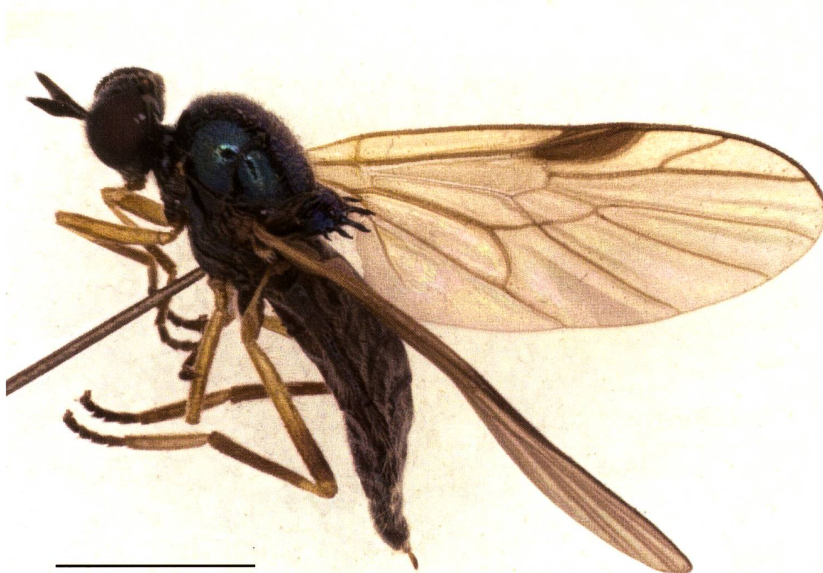
Fig. 1. Beris hauseri Stuke, 2004, femelle (Neuchâtel) (échelle: 2 mm).