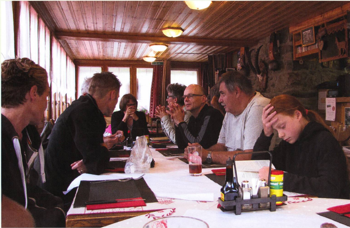
Die Teilnehmenden beim Abendessen.

mit Hannes vom Hotel aus in Richtung Lac Bleu auf. Der schmale Pfad in sehr steilem Gelände verlangte grosse Aufmerksamkeit. Trotzdem waren die vielen floristisch und auch entomologisch artenreichen Wiesen augenfällig und luden immer wieder zu einem ausgedehnten Halt ein. Gegen Ende des Tages traten die Teilnehmenden individuell die Heimreise an.