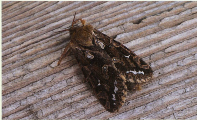
Der Wurzelbohrer Korscheltellus fusconebulosa.