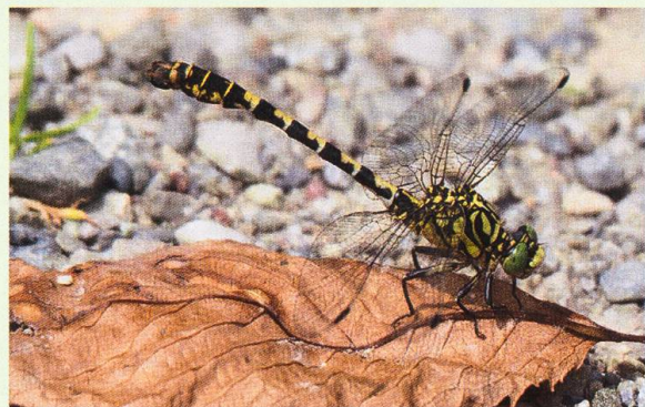
Ein Männchen der Kleinen Zangenlibelle Onychogomphus forcipatus sonnt sich auf dem Kiesweg entlang der Limmat.