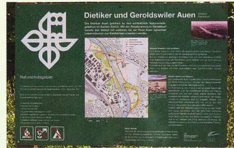
Die Autobahnbrücke über die Limmat durchschneidet die Dietiker Auen, die zu Fuss erkundet werden können (links). Auf Informationstafeln (oben), die Auskunft über Entwicklung und Schutzziele des Auengebiets geben, sind die für das Publikum offenen Wege eingezeichnet.

Die Verschiebung der Exkursionsgruppe in die Geroldswiler Auen über die Limmat entlang der Autobahnbrücke lässt erleben, wie hart Natur und Technik hier aufeinanderprallen. Doch schon bald tauchen wir erneut in renaturiertes Auengebiet ein. Hier wurde vor zwölf Jahren im Rahmen der Neukonzessionierung des Kraftwerks Wettingen auf neun Hektaren ehemaligen Ackerlandes eine halboffene Auenlandschaft mit einem grossen Seitenarm der Limmat geschaffen. Als allgemein seltene Pflanzenart der regelmässig gemähten Auenwiesen gedeiht hier der Kantige Lauch Allium angulosum . Bei Erfolgskontrollen zwischen 2005 und 2014 konnten im Gebiet 30 Libellenarten nachgewiesen werden. Bemerkenswert sind u. a. die beiden Blaupfeilarten Orthetrum albistylum und O. brunneum . Abseits des Wassers treffen wir da und dort auf Männchen der Gefleckten Smaragdlibelle Somatochlora flavomaculata , die in typischer Weise entlang von Büschen patrouillieren und durch ihre neugierige Art aus der Nähe die kennzeichnenden dunkelgelben Flecken am Hinterleib erkennen lassen.