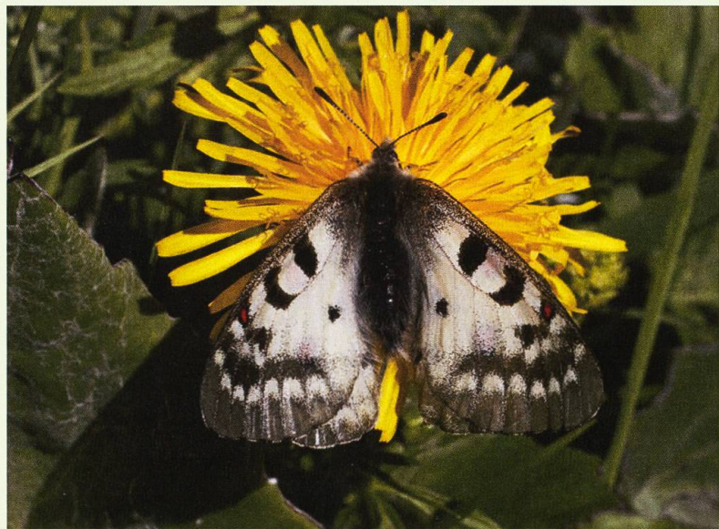
Der Hochalpen-Apollo Parnassius sacerdos .