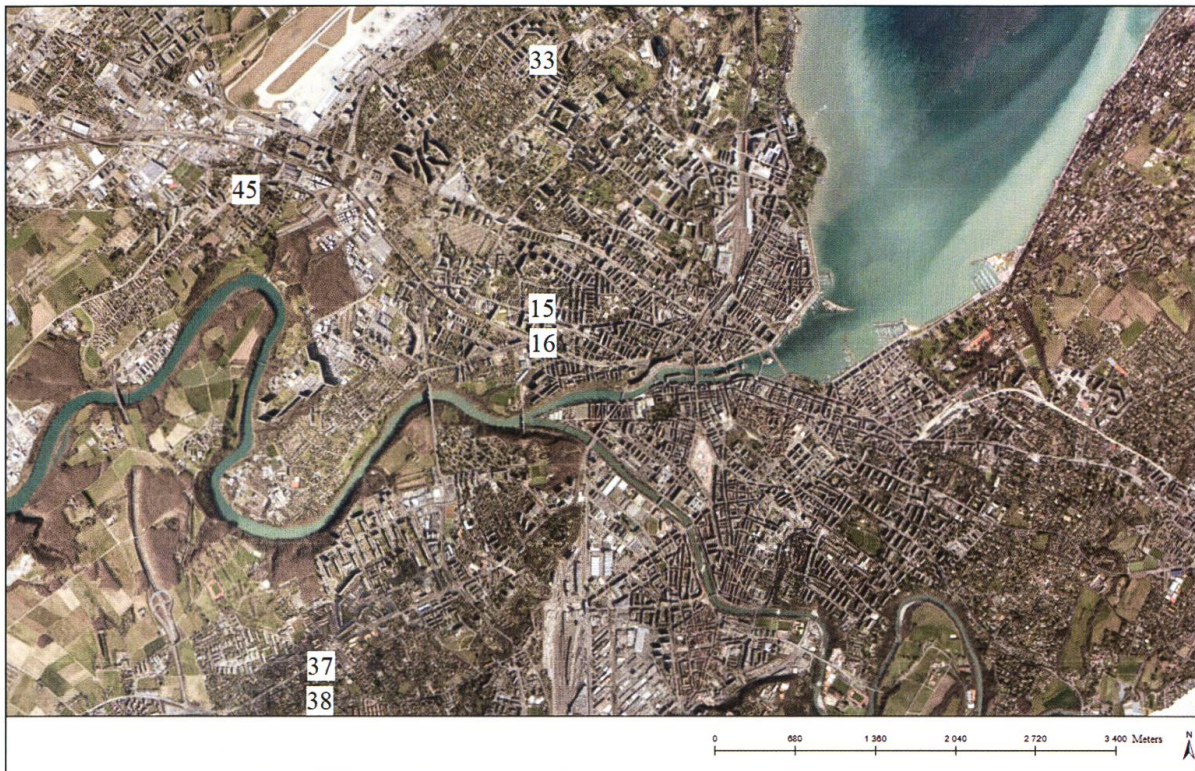
Fig. 1. Distribution des six toitures végétalisées échantillonnées dans l'agglomération genevoise. Les numéros se réfèrent aux codes des toitures végétalisées donnés dans le tableau 1.