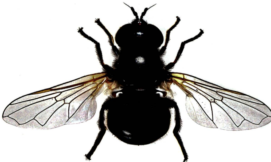
Fig. 3. Psilota atra (Loew, 1817) femelle, une nouvelle espèce de la faune suisse observée au Bois des Bouchets en mai 2020.

aussi, à l'instar de Myolepta vara mentionné ci-dessous, la présence de populations importantes d'arbres sénescents ( Quercus spp., Pinus spp.) qui lui fournissent des habitats larvaires adéquats. La découverte de l'espèce peut être interprétée comme un signe d'encouragement à poursuivre la gestion forestière pratiquée dans cette réserve avec un maintien, voire un agrandissement, des îlots de sénescence.