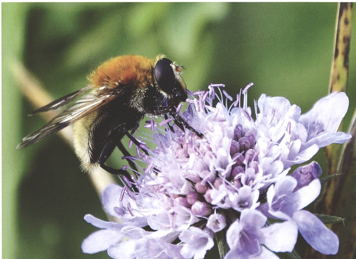
Fig. 4. Sericomyia superbiens (Müller, 1776), sur une scabieuse ( Scabiosa sp.) le 12 octobre 2020 au Marais de Pré-Bordon dans la commune de Gy.

éléments d'écologie. Sericomyia superbiens est probablement répandue dans d'autres zones humides du canton de Genève où des relevés tardifs devraient être réalisés pour détecter sa présence.