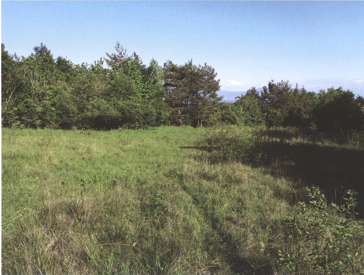
Fig. 2. Bas-marais au Bucley à La Rippe (VD), lieu de capture d' Ebaeus collaris . Vue en direction du sud.

Les critères morphologiques fournis par Evers (1979), Pardo Alcaide (1962, 1967) et Plata-Negrache (2009) pour le genre Ebaeus , ont permis d'identifier le spécimen récolté. Parmi les huit espèces d' Ebaeus du groupe collaris comportant un pronotum de couleur rouge et l'apex des élytres jaune-rougeâtre (y compris les excitateurs) en Europe centrale (Evers 1979) et dans le bassin méditerranéen occidental (Plata-Negrache 2009), seules deux espèces ont à la fois les segments antennaires jaunes et sombres ainsi qu'une pubescence des élytres double jaune et sombre: Ebaeus collaris et E. battonii .