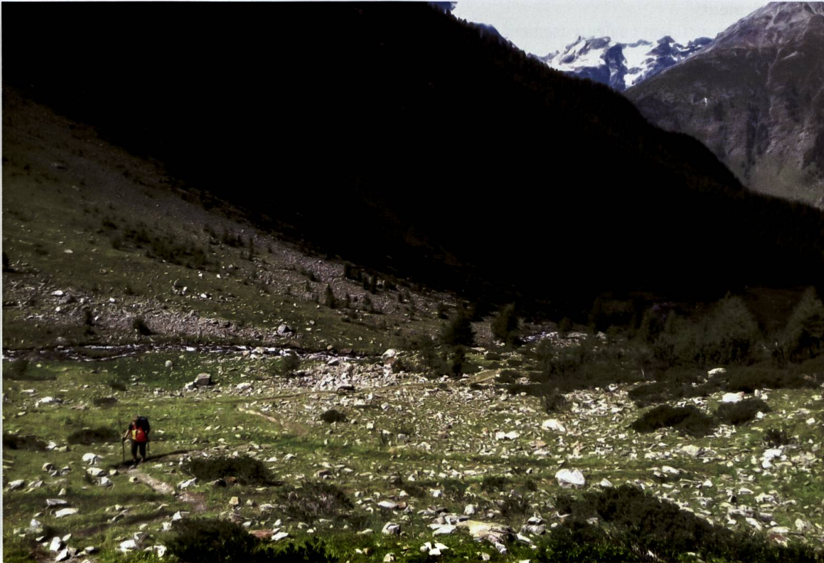
Fig. 2. Lieu de capture d' Amara brunnea dans le Val Zeznina, à proximité du Parc national suisse.

que les élytres), aux angles postérieurs complètement arrondis et par la forme caractéristique de son édéage et du crochet du paramère droit (Fig. 1). En outre, l'absence de fouet à l'origine de la striole scutellaire permet de la distinguer d' A. praetermissa (C. R. Sahlberg, 1827) et sa dent labiale simple (et non bifide) permet de la séparer d' A. bifrons (Gyllenhal, 1810), deux espèces auxquelles elle ressemble.