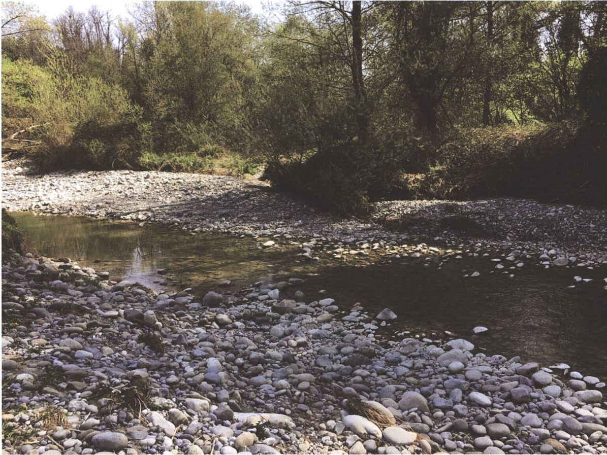
Fig. 2. Habitat de Labidura riparia sur le cours de La Loire à Chancy (GE), 16 avril 2020.

Carabidés (Coleoptera) de Suisse (Chittaro et al. 2020), trois spécimens de Labidura riparia ont en effet été découverts dans le canton de Genève: