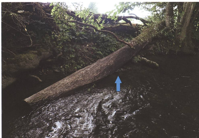
Abb. 2 und 3: Fundorte der Adulttiere P. acuminatus.