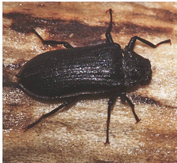
Abb. 5: Aufnahme P. acuminatus an Totholz.

Angespornt durch einen Larvenfund im Jahr 2019 am Aabach bei Lenzburg (AG) im Zuge des Nationalen Programms zur Überwachung der Fließgewässer (NAWA Trend), beprobten wir im darauffolgenden Jahr am gleichen Fundort gezielt aus dem Wasser ragendes Totholz in strömungsreichen Zonen. Am 9. Juli 2020 entdeckten wir zwischen unterspülten Baumwurzeln eine weitere Larve (Abb. 1). Bei einer zweiten Begehung am 21. Juli beobachteten wir an teilweise im Wasser liegendem Totholz dreizehn Imagines (Abb. 2 und 3). Letztere sassen direkt über der Wasserlinie bzw. an der Wasserlinie und wurden durch die Strömung immer wieder benetzt (Abb. 4). Somit passen die Fundorte exakt zu früheren Lebensraum-Dokumentationen