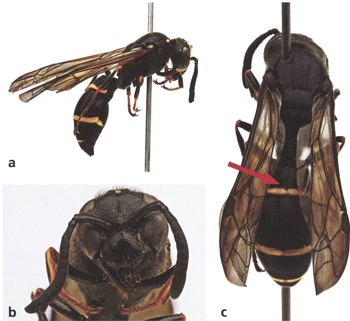
Abb. 1. Belegexemplar (♀) der am Fundort (Abb. 2, 3) vorkommenden Euro-sibirischen Furchen-Lehmwespe Symmorphus angustatus (Zetterstedt, 1838) von der Seite a ), von vorne b ) und von oben c ). Der rote Pfeil weist auf die für die Gattung der Furchen-Lehmwespen ( Symmorphus ) typische Längsfurche auf dem ersten Tergit.

10 Arten vertreten, die alle mit dem Schlüssel in Neumeyer (2019) bestimmt werden können. Sie nisten in oberirdischen Hohlräumen, wobei die meisten Arten vorwiegend Larven von Blattkäfern (Coleoptera: Chrysomelidae) eintragen (Budriené 2003). Einige wenige jagen stattdessen Rüsselkäferlarven (Coleoptera: Curculionidae) oder Raupen von Kleinschmetterlingen (Microlepidoptera), sei es nun ausschliesslich oder vorwiegend (Budriené 2003, Gathmann & Tschardt 1999).