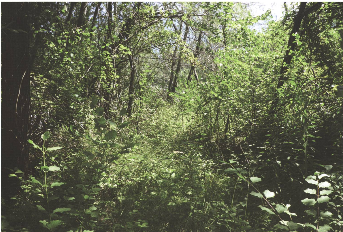
Abb. 3. Fundort (Abb. 2) von Symmorphus angustatus (Zetterstedt, 1838) in einem lichten Auenwaldbereich am Alpenrhein bei Untervaz (GR) am 7.5.2020.