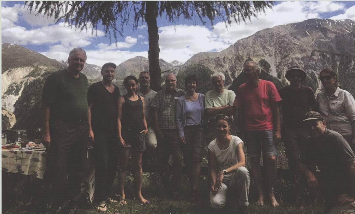
Abb. 1. Gruppenbild in Sta. Maria Val Müstair (CH), am Schluss der EGZ-Exkursion ins Vinschgau (I), am 5.07.2020.