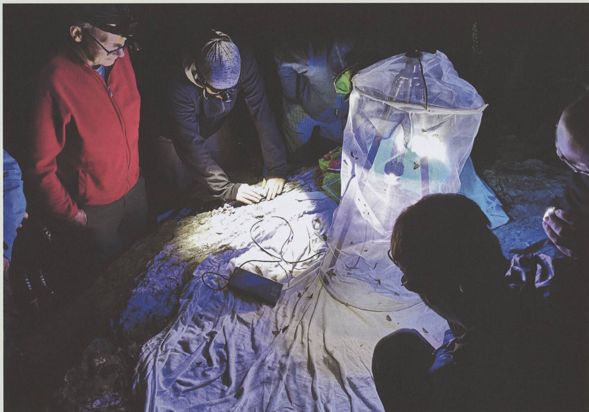
Piégeage nocturne dans le vallon des Morthéys en août 2020.