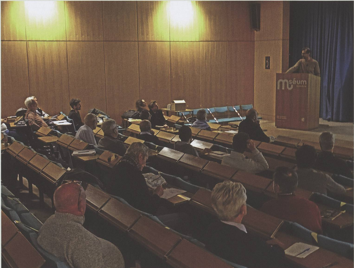
Réunion des Entomologistes Rhône-Alpins (RERA) au Muséum de Genève le 10 octobre 2020.