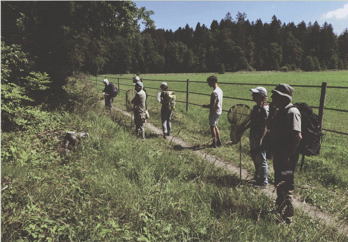
Une lisière ensoleillée et des entomologistes armés de filets : la chasse aux syrphes est lancée.

contributeurs efficaces, récoltant environ un sixième des 6885 échantillons de fourmis, avec une soixantaine d'espèces différentes ! Le projet de poursuivre l'inventaire des fourmis à travers le canton avec les personnes intéressées et de proposer des ateliers de détermination a été mis en veille en 2020 mais sera relancé en 2021.