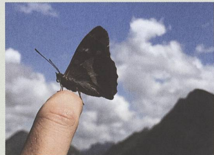
Concurrence entre Brenlaire, Folliéran et papillon, dans la vallée du Motélon, 25 juillet 2020.