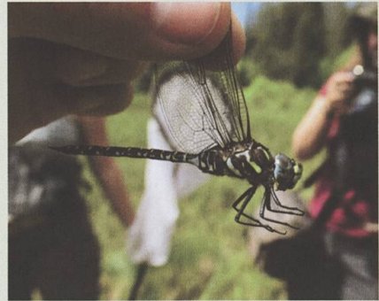
Grande découverte dans la région de la Berra le 27 juin 2020 : Aeshna subarctica .