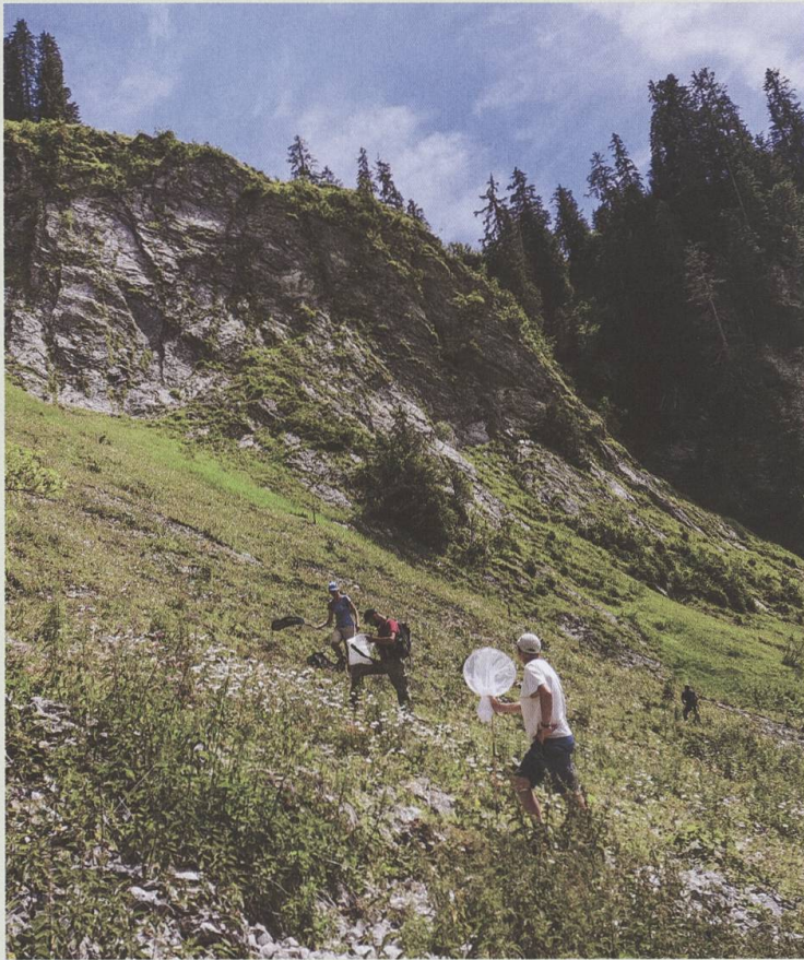
A la recherche des papillons dans la région du Jaun le 4 juillet 2020.