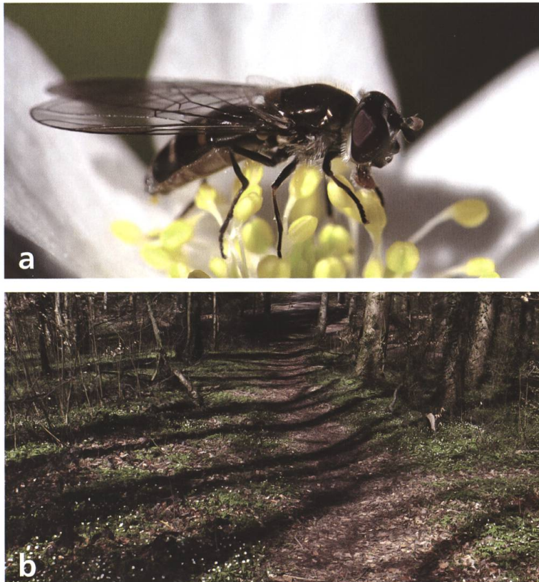
Abb. 1. a) Melangyna pavlovskyi (Weibchen) auf blühendem Buschwindröschen ( Anemonoides nemorosa); b) im Wald Pöschwies bei Regensdorf (ZH) am 24.03.2021. Man beachte die Reihe von langen Haaren auf den unteren Augenpartien.

gross, dass die Habitatpräferenz von M. pavlovskyi von den Blattlausarten abhängt, auf die sie als Larve angewiesen ist.