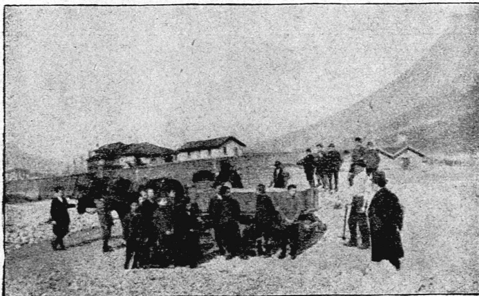
SCUOLE DI LUGANO — Lezioni all'aperto: Alla foce del Cassarate (delta; terreno alluvionale; storia di un ciottolo; estrazione della sabbia).