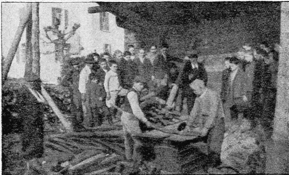
SCUOLE DI LUGANO — Visite a fabbriche, officine, musei: La sega elettrica e la legna da ardere.