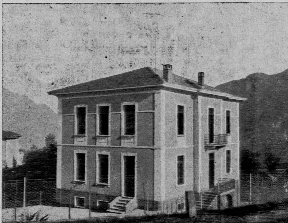
Il nuovo palazzo scolastico di Montagnola