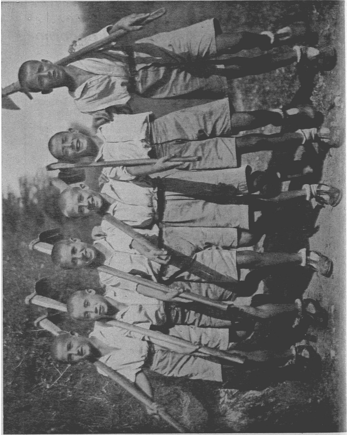
Mani, cuore, testa. — Non vedere che gli sport, il cinema e la radio sarebbe tradire la gioventù e la terra dei padri.