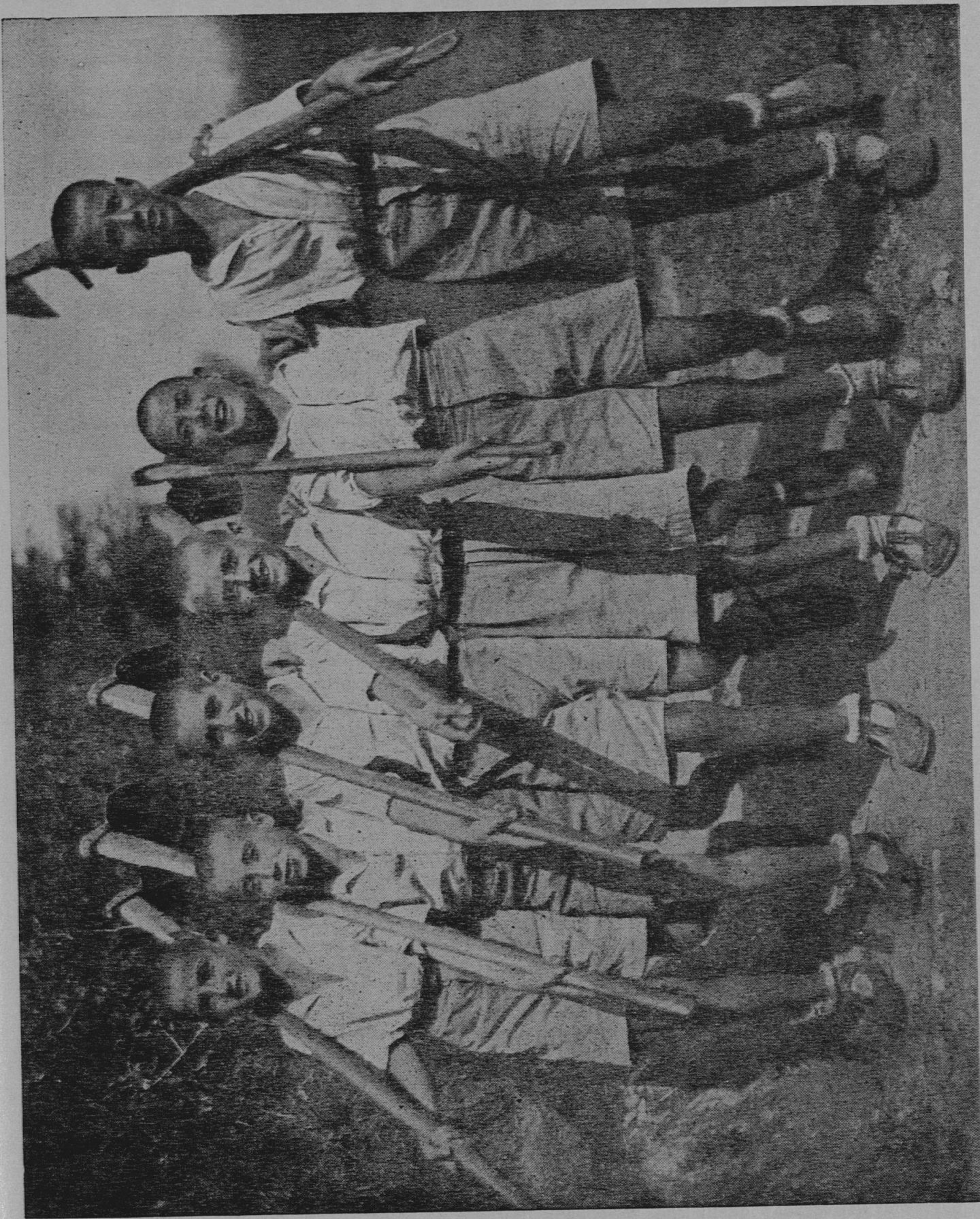
Mani, cuore, testa. — Non vedere che gli sport, il cinema e la radio significa tradire la gioventù e la terra dei padri, i