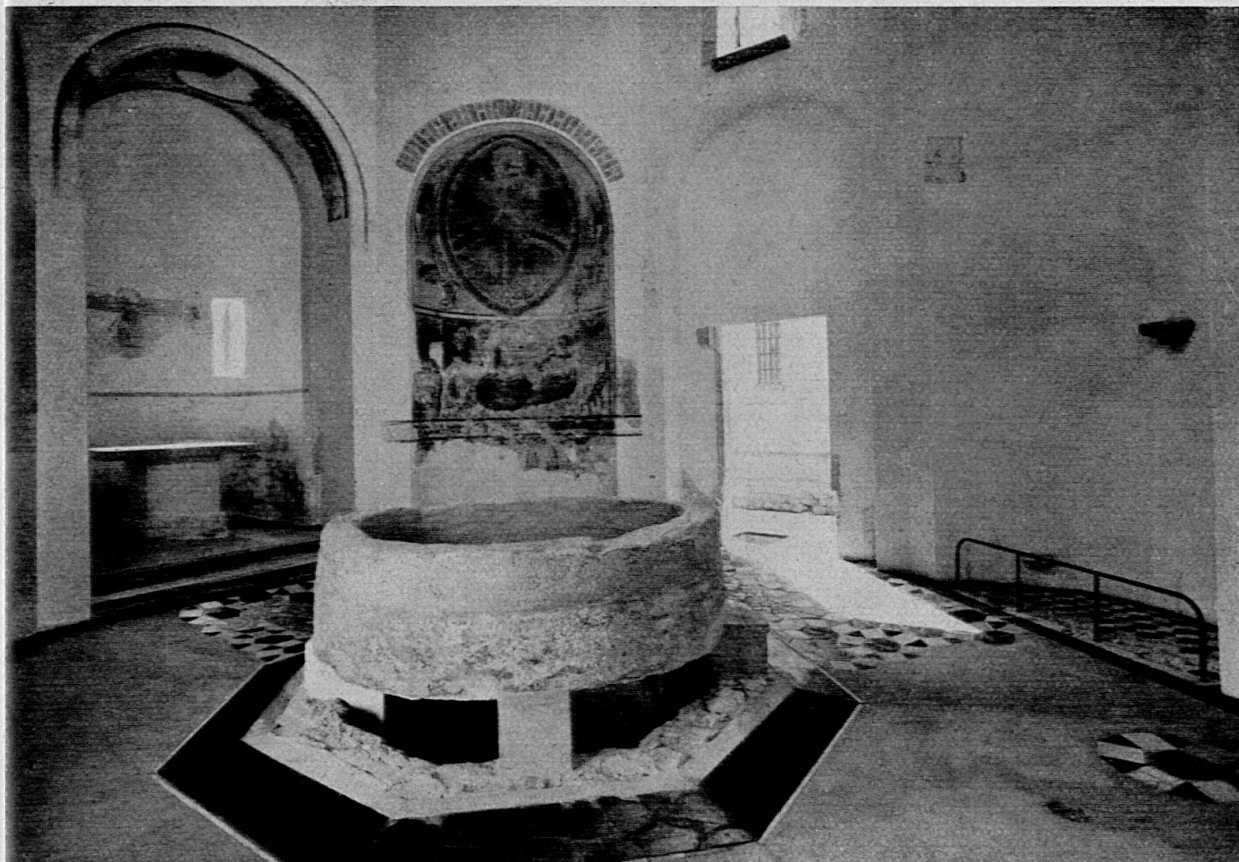
Lo stesso particolare dopo il restauro

Dopo una preparazione, che nel V sec. durava ancora tre anni (catecumenato), e durante la quale il postulante poteva partecipare solo parzialmente alle cerimonie, all'inizio della quarta quaresima il catecumeno poteva iscriversi per ricevere il battesimo (amministrato solo due