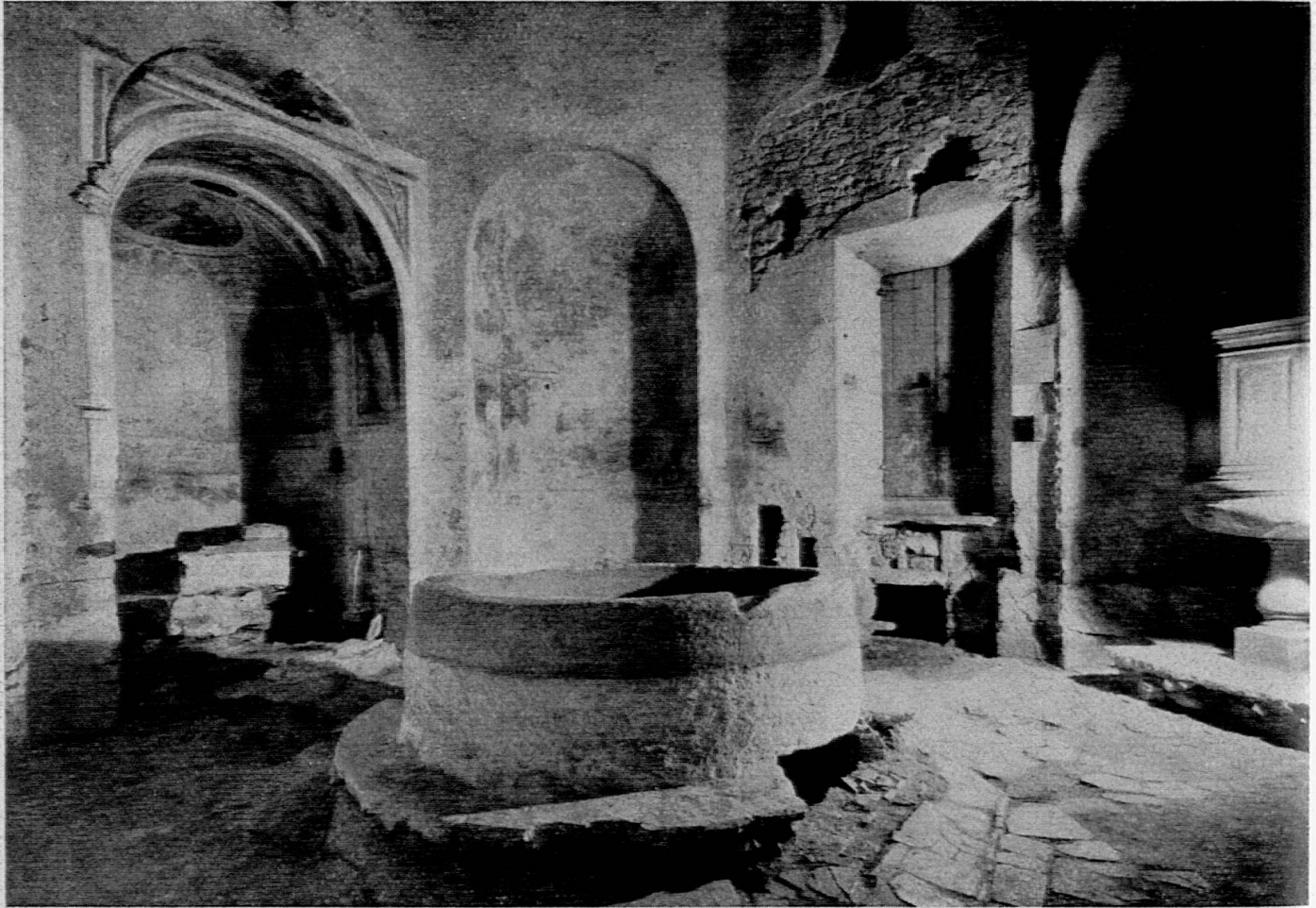
Particolare dell'interno prima del restauro

In conclusione, quindi, l'opera di isolamento, molto ben condotta, ci permette di vedere finalmente almeno in modo sommario la struttura originale e le più antiche modificazioni del Battistero.