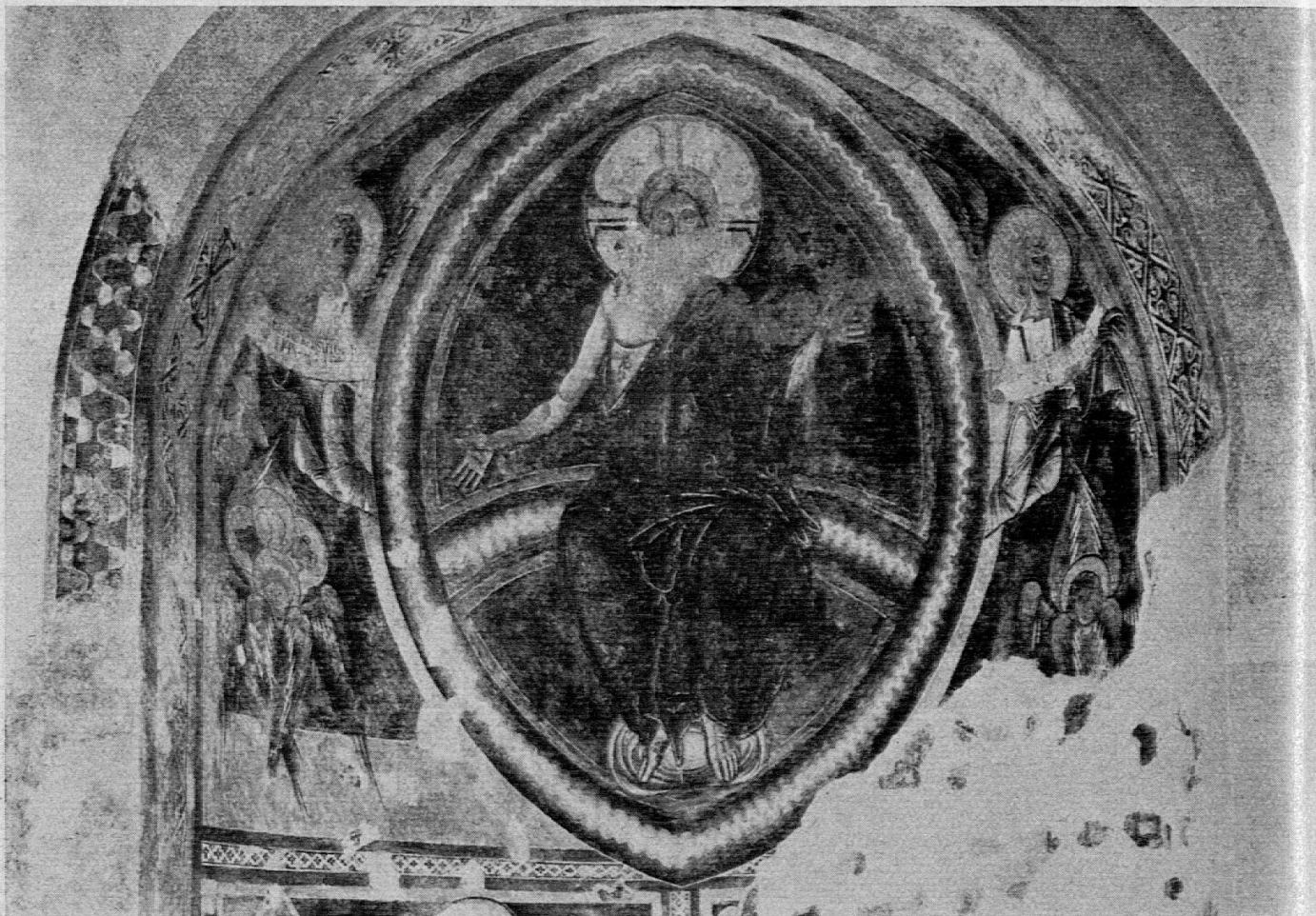
Particolare dello stesso affresco. È la conclusione del ciclo redentivo (nel nicchione di destra la natività, nell'abside la crocifissione, nel nicchione di sinistra il giudizio finale. Tutta la composizione è notevole per felicità di movimento e di disegno. È restato escluso l'angelo in basso, che potete vedere nella riproduzione precedente. È cosa di rara bellezza.

vimento per evitare infiltrazioni di pioggia ed alle mutate consuetudini (battesimo oramai amministrato prevalentemente ai fanciulli).