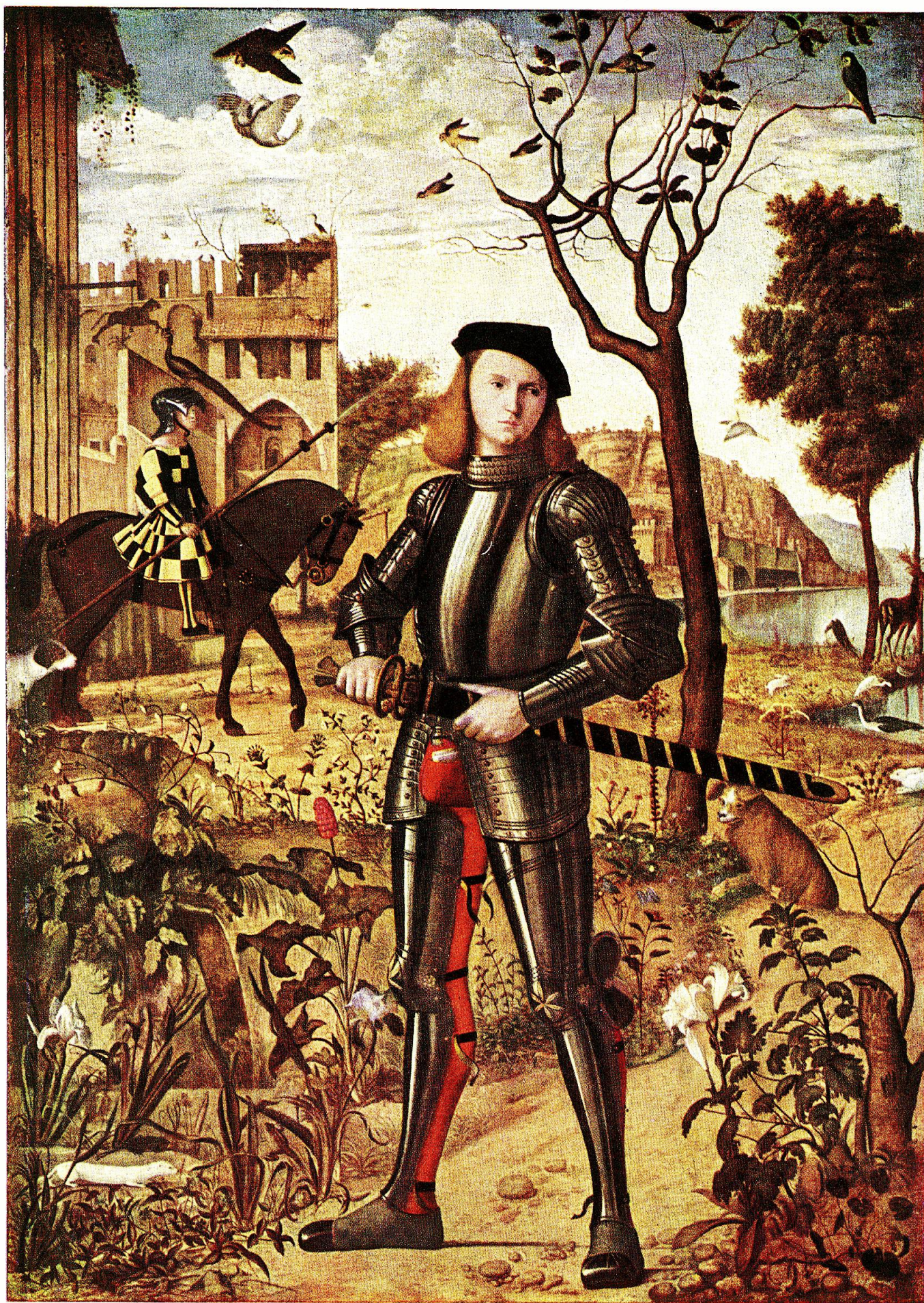
Vittore Carpaccio: Giovane armigero