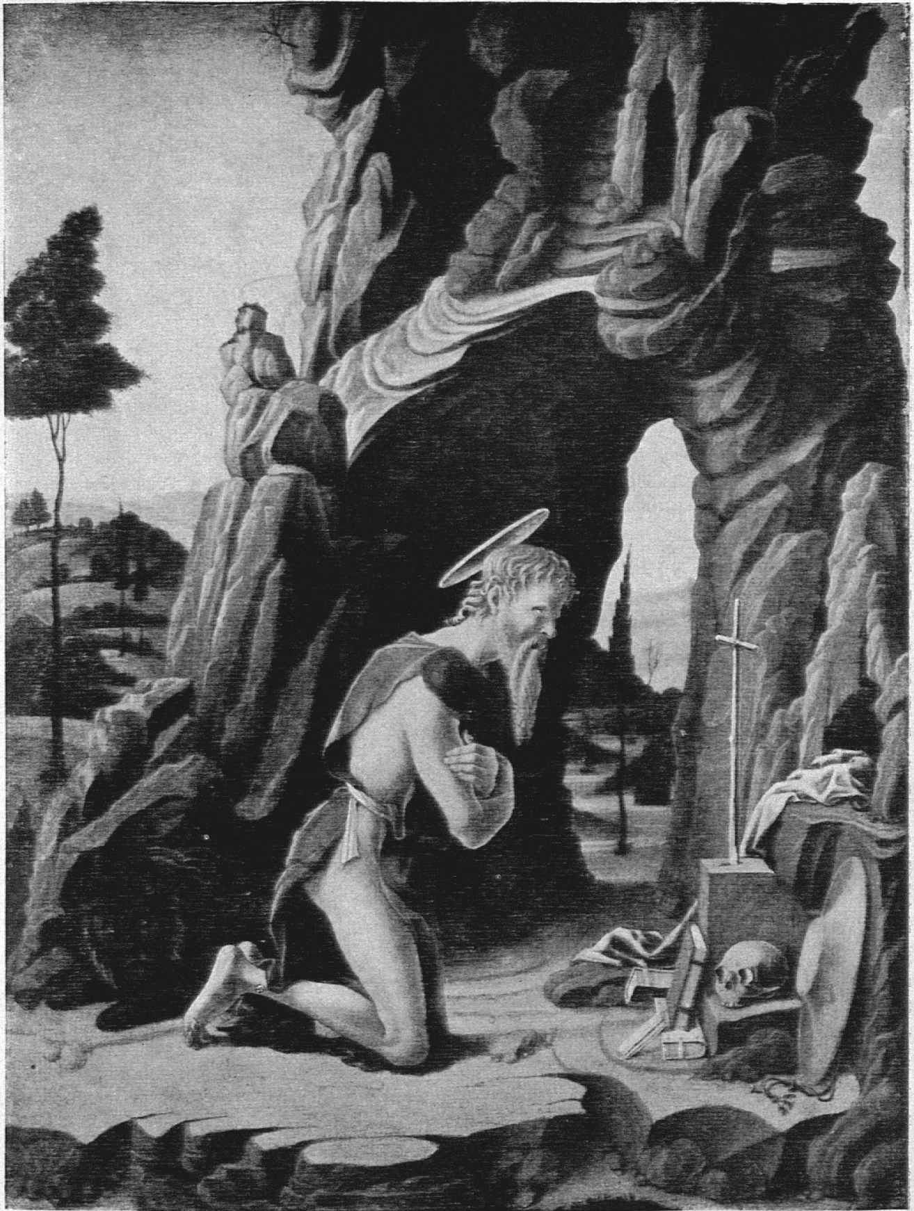
Marco Zoppo: San Gerolamo