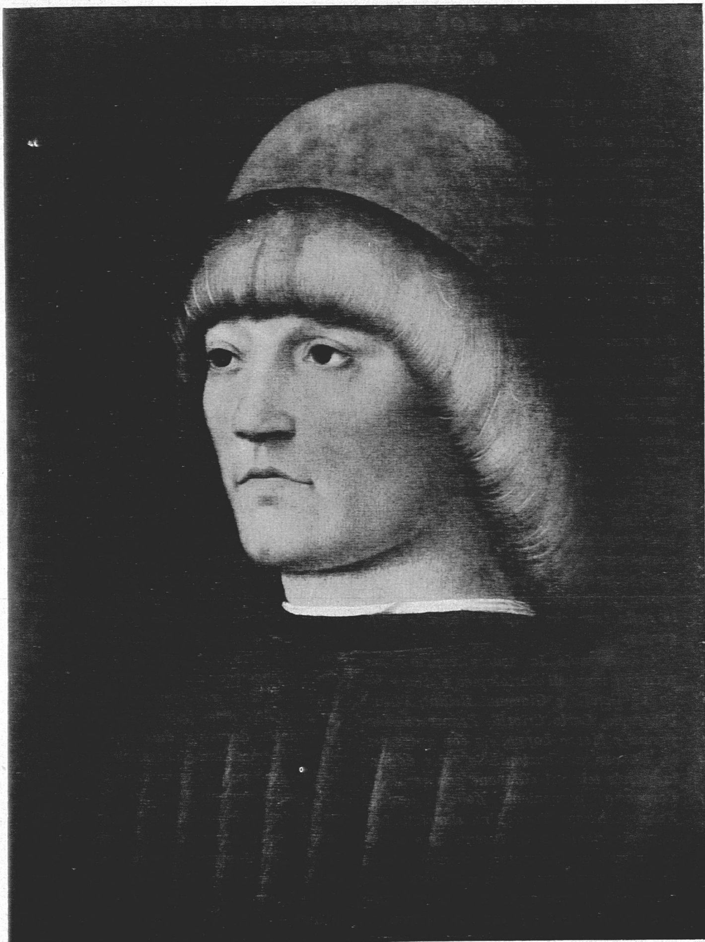
Alvise Vivarini: Ritratto di giovane (attr.)