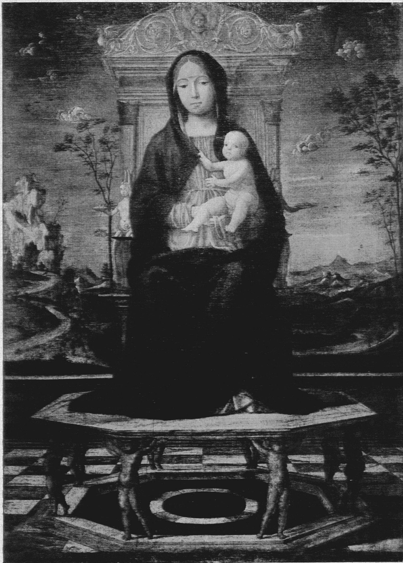
Lorenzo Costa: Madonna in trono (attr.)