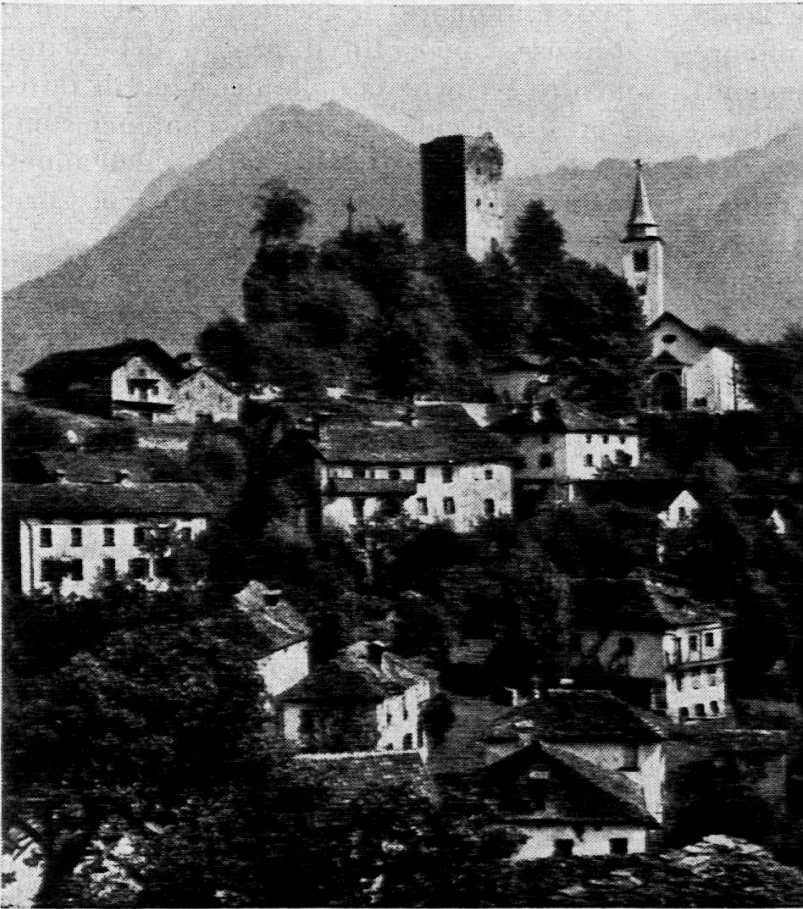
Santa Maria Calanca: La torre medievale e la parrocchiale.

Se nei paesini di montagna una chiesa è da ammirare, solitamente ciò accade per la semplicità o per la rusticità della sua linea architettonica o per l'ingenuità, pur spesso saporosa, della sua decorazione e delle suppellettili che ne ornano l'interno. Raramente geniali architetti, raffinati pittori e decoratori hanno dato la loro opera alla creazione di monumenti chiesastici in valli remote, se non nello ambito di complessi conventuali. La parrocchiale di Santa Maria in val Calanca è quindi causa di stupore e di emozione a un tempo, specie dopo l'avveduta recente opera di restauro, estesasi dal 1954 al 1958.