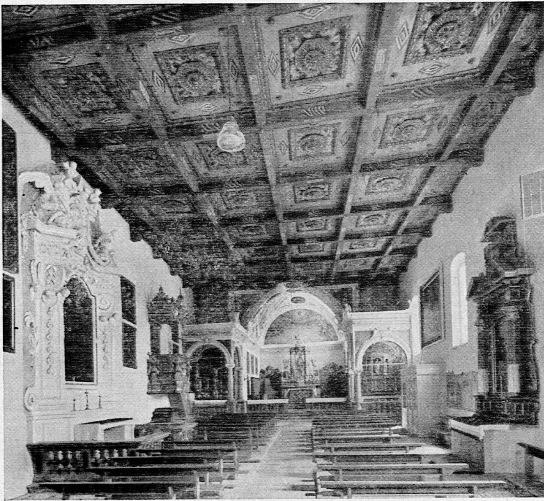
Santa Maria Calanca: Stucchi nella volta del coro.

ta nel 1219 nell'atto di fondazione del Capitolo di S. Vittore in Mesolcina da parte del conte Enrico de Sacco ma si presume debba risalire ad epoca anteriore al 1000. Alla fine del 14, e all'inizio del 15° secolo fu rinnovata, nel 1606 fu ampliata nelle dimensioni attuali, nel 1618 fu aggiunta la cantoria e tra il 1626 e il 1628 fu decorata di stucchi e pitture nella volta del coro e delle due cappelle.