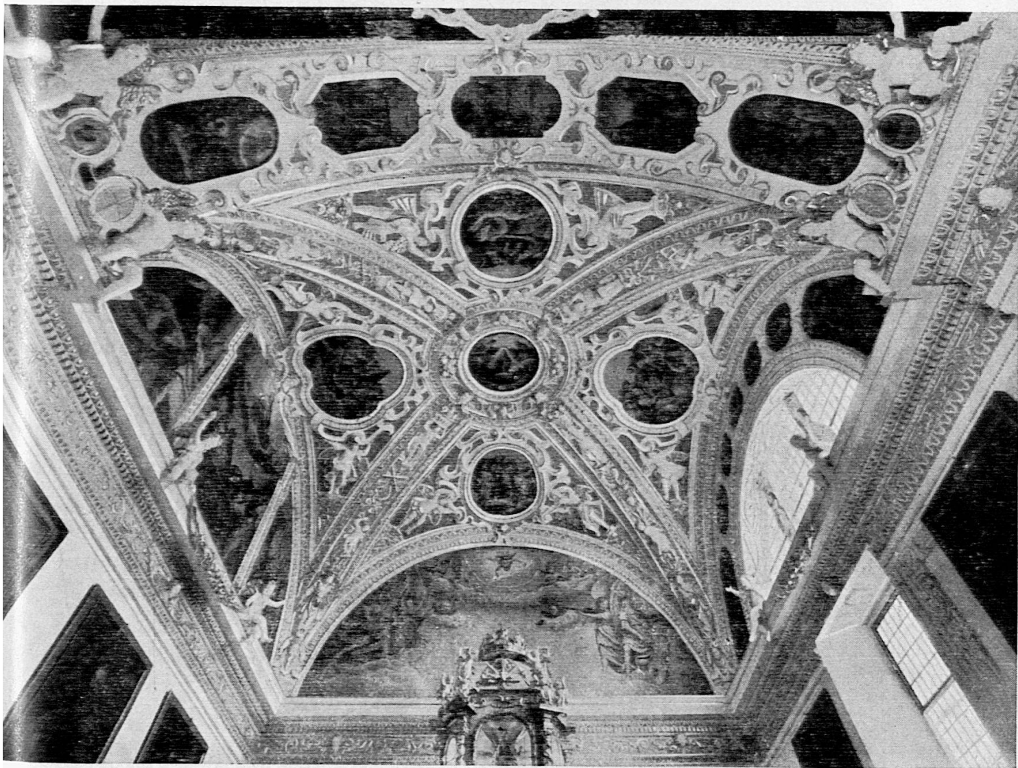
Santa Maria Calanca: L'interno con lo stupendo soffitto a cassettoni.