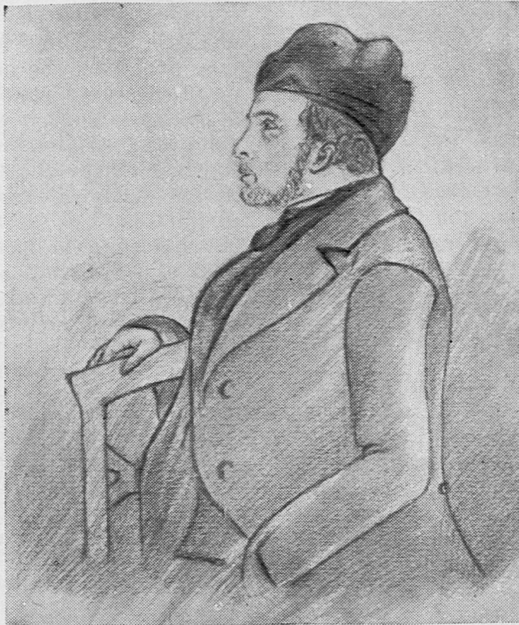
Pietro Peri (nel 1848) Evviva la libertà