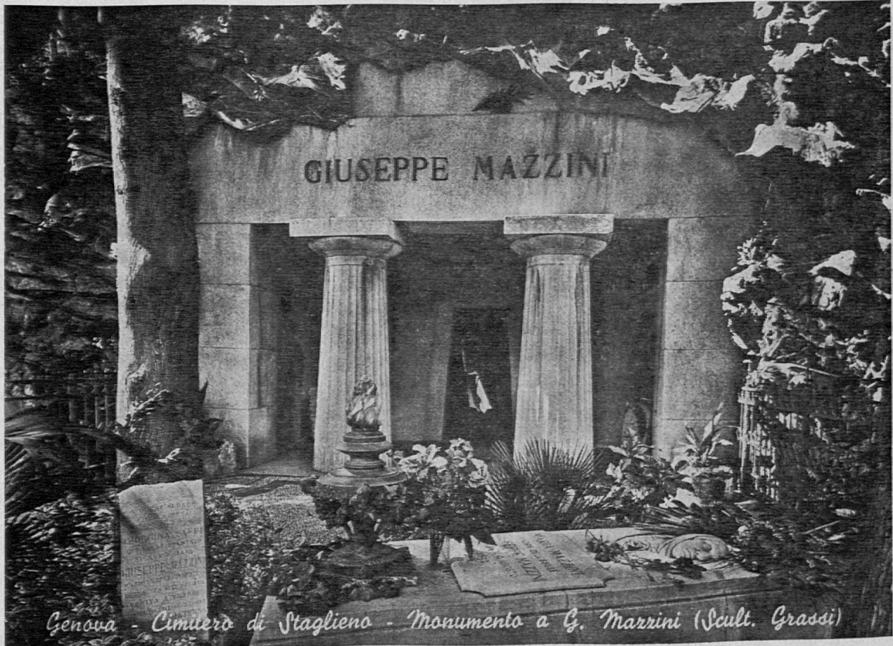
Genova - Cimitero di Staglieno - Monumento a G. Mazzini (Scul. Grassi)

Ad ogni opera vostra, nel cerchio della patria e della famiglia, chiedete a voi stessi: «se questo ch'io fo fosse fatto da tutti e per tutti, gioverebbe o nuocerebbe all'umanità?», e se la coscienza vi rispon-