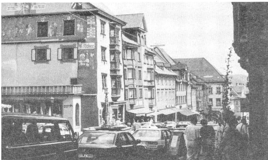
Rottweil in Schwaben: Der Wallfahrtsort für alternative Energiefreaks

Dabei ist längst unbestritten, dass der Energiebereich (einschliesslich Verkehr) mit seinen Kohlendioxid-Emissionen (CO 2 ) zu 50 Prozent zum Treibhauseffekt beiträgt. Mit dem massiven Ausbau an Atomkraftwerken wollen die Stromkonzerne den Planeten Erde retten, weil AKW kein CO 2 freisetzen, aber auch abgesehen von Fragen des «Restrisikos» und der ungelösten Endlagerung von atomaren Brennstäben ist das ein fast hoffnungsloses Unterfangen. Der «Spiegel» 1989: «Wollte man bei den gegenwärtigen Entwicklungstrends den Weltverbrauch an fossilen Brennstoffen bis zum Jahr 2025 mit Hilfe der Kernkraft auch nur um einen Drittel senken, müsste alle drei Tage ein neuer 1000-Megawatt-Atommeiler ans Netz gehen.» Die Kosten: 100 Milliarden Dollar pro Jahr. Professor Wilfried Bach, Mitglied der Enquete-Kommission, hält dem entgegen: würde man diese Summe in bessere Energietechniken investieren, könnte sie den fünf- bis siebenfachen Effekt haben.