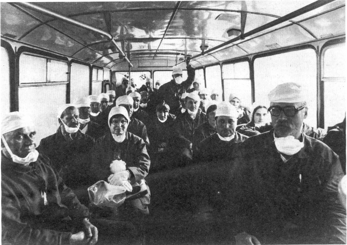
Arbeiter auf dem Weg zum Reaktor von Tschernobyl, kurz nach dem Unfall im April 1986.