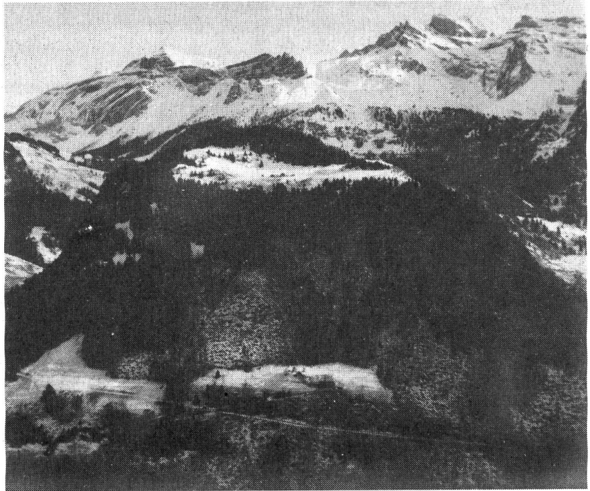
Der grüne Wellenberg.

Die Fortführung der elektrischen Stromversorgung durch Atomkraftwerke steht auf dem Spiel. Der Nachweis der Verwirklichbarkeit der Endlagerung von schwach- und mittelaktivem (kurzlebigen) Atommüll ist eine Bedingung, und das Moratorium läuft unerbittlich ab. Das ist der aktuelle wirtschaftliche Zwang. Dieser Zwang diktiert die sich zur Zeit überschlagende Hektik für ein Endlager im Wellenberg. Der Vertrag über die Abgeltungen mit der Genossenschaft für nukleare Entsorgung Wellenberg (GNW) und die seit Jahren betriebene 'Politik der kleinen Geschenke' der NAGRA haben in Wolfenschiessen