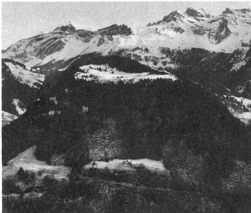
Der grüne Wellenberg