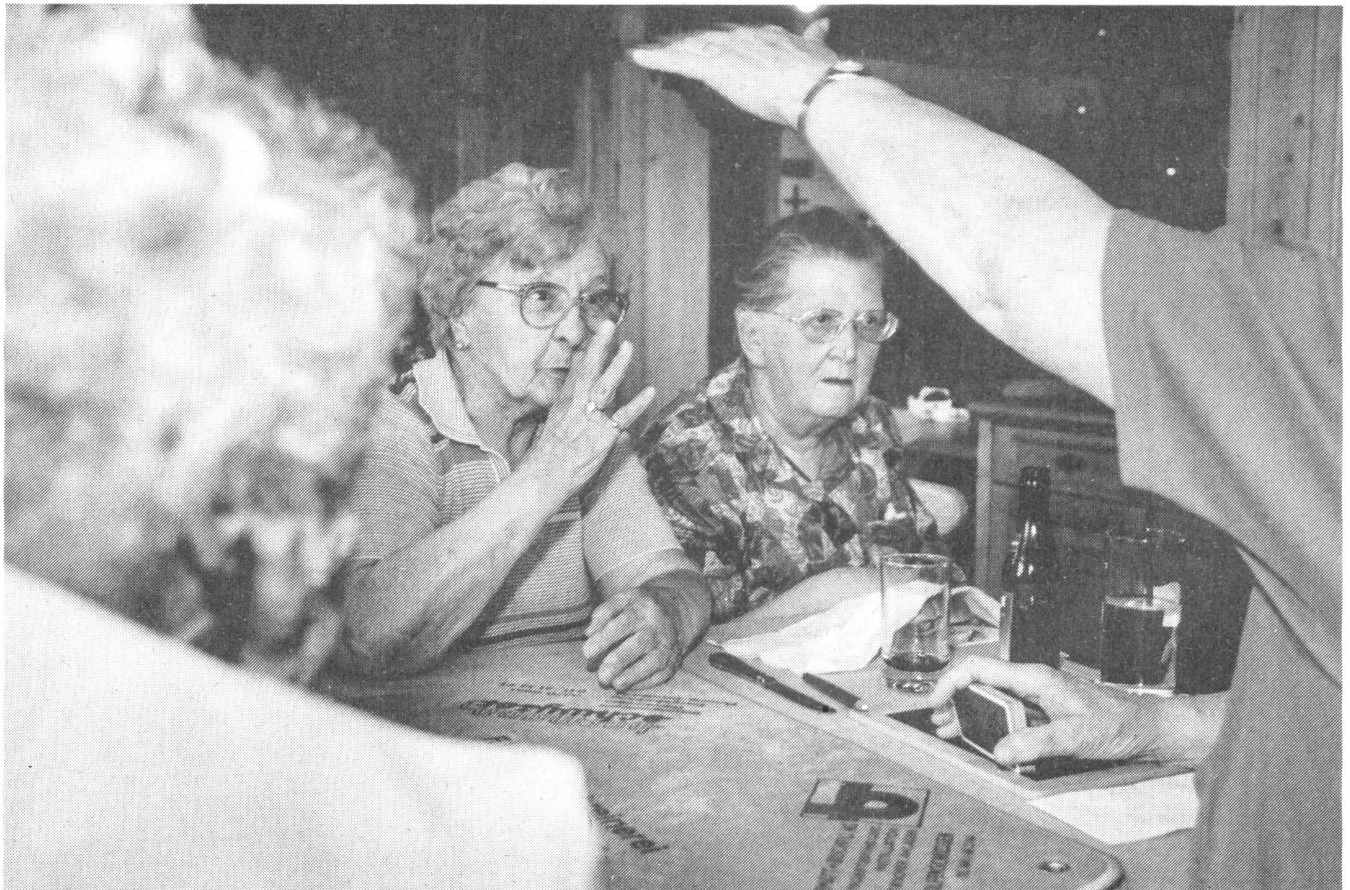
Die Erinnerung verursacht Angst bei den Frauen am Jasstisch: "Der Wellenberg ist ein Erdbebengebiet."