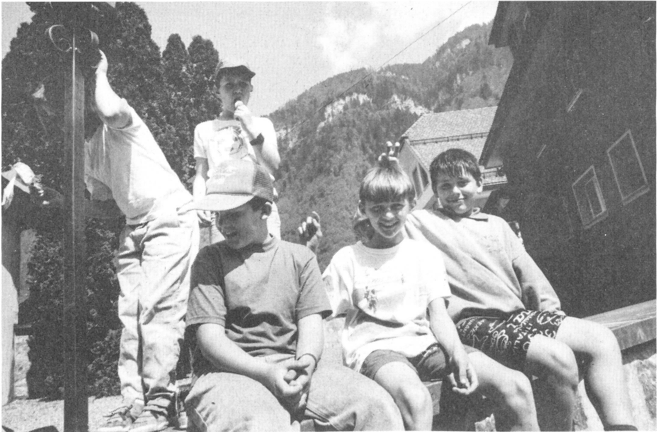
Die Kinder haben kein Verständnis für die Gegner: "Ich weiss nicht, weshalb die so blöd tun."