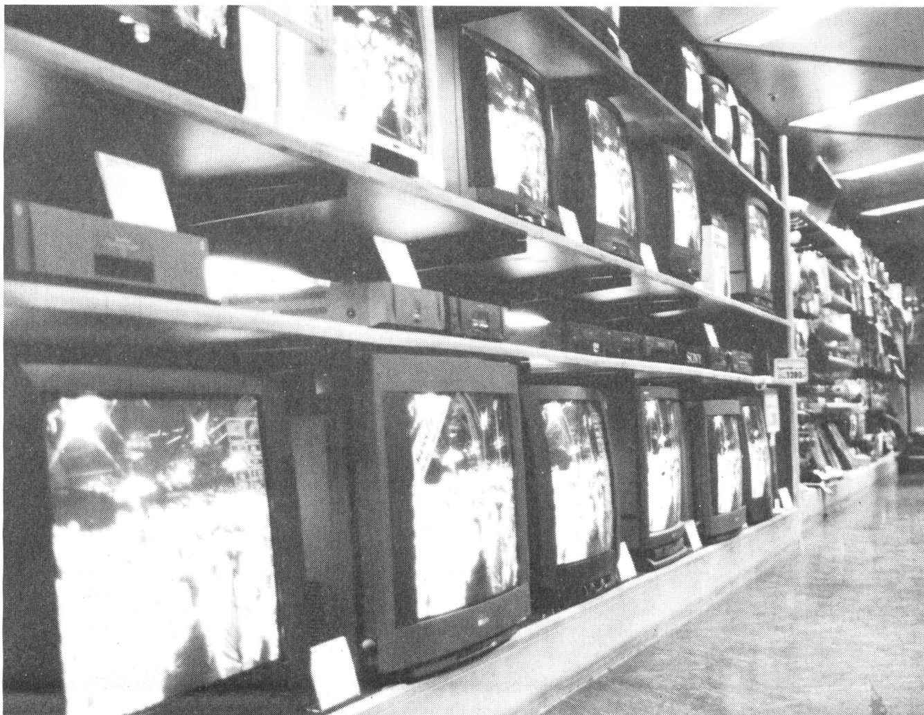
„Dann sollen sie doch Gipfeli essen“ - Fernsehwand im Warenhaus.