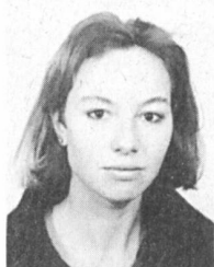
Von Veronica Gurzeler, freie Journalistin in Zürich.

Diese Geschichte handelt von zwei Männern, die versuchen, vom Wald und mit dem Wald zu leben und dadurch immer wieder mit dem Herkunft des Begriffs Nachhaltigkeit konfrontiert werden, denn dieser stammt aus dem Forstwesen. Obwohl sie das Wort nachhaltig kaum benutzen, setzen sie sich mit der nachhaltigen Lebensweise täglich auseinander. Ein Abstecher ins Emmental.