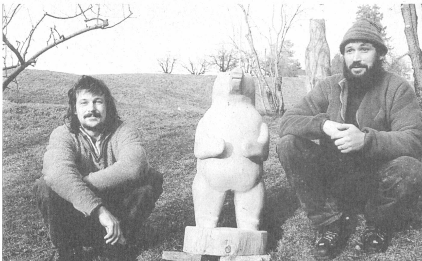
Hausi (links) und Thömu haben einen grossen Teil ihrer Möbel selbst geschreinert. In der Freizeit sägt Thömu mit der Motorsäge Holzfiguren aus Baumstämmen.

ingenieur war schon hier“, sagt Thömu. Im Wyttbach finden sich auf relativ kleiner Fläche Bäume jeden Alters. Zwei Arten sind vor allem vertreten: die Fichte und die Tanne. „Daneben erfüllt aber auch die Buche eine wichtige Funktion, obwohl sie von manchen Leuten verächtlich Krüppelbaum genannt wird“, sagt Thömu. Ein Plenterwald ohne Buchen hat über kurz oder lang einen sauren Boden, weiss man heute; die Buche holt den Kalk aus der Tiefe der Erde, über 400 verschiedene Lebewesen brauchen die Buche als Lebensraum, während die Fichte nur für einige wenige attraktiv ist. Deshalb wird die Buche auch die Mutter des Waldes genannt.