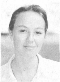
Von Veronica Bonilla Gurzeler, freie Journalistin in Zürich

Stecker einstecken, Schalter anknipsen und schon leuchtet die Lampe. Strom, zu jeder Zeit ausreichend verfügbar, ist heute etwas Selbstverständliches geworden. E&U ist den Drähten hinter der Steckdose nachgegangen, zu Trafostationen und Unterwerken, über Nieder- und Hochspannungsleitungen bis dahin, wo der Strom produziert wird.