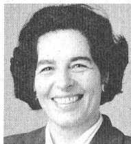
Ursula Koch, Präsidentin SP Schweiz

Nationalrat Ruedi Rechsteiner, Ökonom, kandidiert in Basel-Stadt wieder für die SP. Er ist Präsident des Nordwestschweizer Aktionskomitee gegen Atomkraftwerke (NWA) und Mitinitiant der Solar-Initiative und der Energie-Umwelt-Initiative. Ihm ist es gelungen, mit einer kantonalen Volksinitiative im Kanton Basel-Stadt eine Lenkungsabgabe auf Strom von 5 Rp./kWh einzuführen – der erste Ökobonus in der Schweiz. Im März 1999 hat er zusammen mit der SES eine Aufsichtsbeschwerde gegen die Verschleppung der Entsorgungsfinanzierung von Atomanlagen durch den Bundesrat eingereicht. Zahlreiche Bücher und Veröffentlichungen über Energiefragen, ökologische Steuerreform und marktwirtschaftliche Instrumente im Umweltschutz.