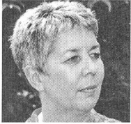
Doris Stump, Nationalrätin SP Aargau

Nur mit dem Ausstieg aus der Atomenergie ist echte Nachhaltigkeit in der Energiepolitik erreichbar. Die erneuerbaren Energien müssen deshalb gefördert und die Energieeffizienz muss verbessert werden. Dazu sollen die Abgaben auf den nichterneuerbaren Energieträgern eingesetzt werden. Die ökologische Steuerreform muss so ausgestaltet werden, dass das Energiesparen attraktiv und der Energieverbrauch massiv reduziert wird.