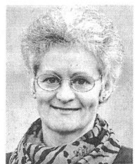
Pia Hollenstein, Nationalrätin Grüne St.Gallen

Mittelschullehrerin am Bündner Lehrerseminar in Chur, Bündler SP-Nationalrätin seit 1995, Vizepräsidentin der Kommission für Umwelt, Raumplanung und Energie (UREK). Angefangen als regionale Aktivistin mit dem erfolgreichen Kampf um die Redimensionierung der gigantischen Ausbauprojekte der Kraftwerke Brusio AG am Berninapass ist Silva Semadeni heute energiepolitische Sprecherin der SP Schweiz. Sie engagiert sich für eine Wende in der nationalen Energiepolitik. Nebst einer Abgabe auf nichterneuerbaren Energieträgern und einer ökologischen Steuerreform fordert sie umwelt- und berggebietsfreundliche Rahmenbedingungen für den liberalisierten Strommarkt.