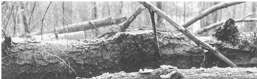
Der Sturm «Lothar» hat allein im Kanton Bern Holz umgeworfen, dessen Energiegehalt dem Vierfachen der jährlichen Produktion des AKW Mühlebergs entspricht.

Ein weiteres Hemmnis besteht im bisher aufwendigeren Planungsprozess von Holzheizungen gegenüber Öl- und Elektroheizungen. Dies ist ein sehr ernst zu nehmendes Problem. Hier haben kantonale Energiefachstellen eine wichtige Führungsaufgabe. Es ist heute nicht mehr sinnvoll, jede einzelne Holzheizungsanlage im Detail auszulegen und bei der Ausführung Mängel zu riskieren. Durch standardisierte Angebote mit klaren Rahmenbedingungen und transparenten Ausschreibungsverfahren (möglichst auf dem Internet) kann der Einzelaufwand massiv reduziert werden. Gleichzeitig führt eine solche Konkurrenz zu billigeren Preisen. Ein kantonaler Förderbeitrag für Kleinanlagen könnte an ein solches offenes Angebotsystem geknüpft werden. Auch die Ausführungskontrolle muss systematisiert und von den Energiefachstellen überwacht werden.