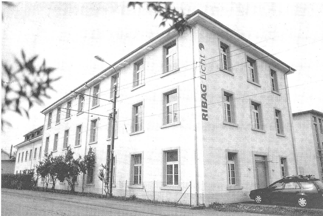
Die Firma Ribag AG in Muhen.