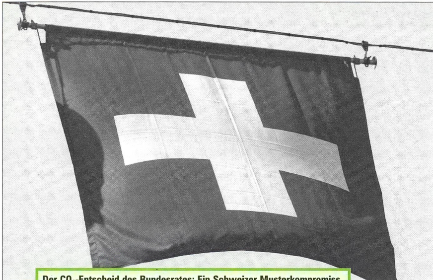
Der CO 2 -Entscheid des Bundesrates: Ein Schweizer Musterkompromiss.

pens respektive Gegner einer CO 2 -Abgabe mehr als unzufrieden. Die Politik- und Wirtschaftsallianz rund um Erdölvereinigung, Autolobby und economiesuisse bläst nun unverblümt zum Kampf gegen eine wirkungsvolle CO 2 -Abgabe. Das «Energieforum Schweiz», das als Schaltstelle zwischen Politik und den Vertretern der Strom-, Bau- und Wirtschaftsbranche dient, äussert sich in seiner Kritik noch sehr diplomatisch und «bedauert, dass der Bundesrat auf Brennstoffen eine CO 2 -Abgabe einführen will». Es wird vor allem moniert, dass der Klimarappen bis 2007 seine Wirksamkeit beweisen muss: «Der auf Ende 2007 verlangte Nachweis ist illusorisch». 6 Viel deutlicher schon äussert sich hingegen die «Aktion für vernünftige Energiepolitik Schweiz» AVES, der über 70 National- und Ständeräte angehören. Für die AVES ist nur der Klimarappen eine sinnvolle Lösung und das CO 2 -Gesetz veraltet. «Die CO 2 -Abgabe ist ein Holzweg», titelt sie in ihrer Medienmitteilung. 6