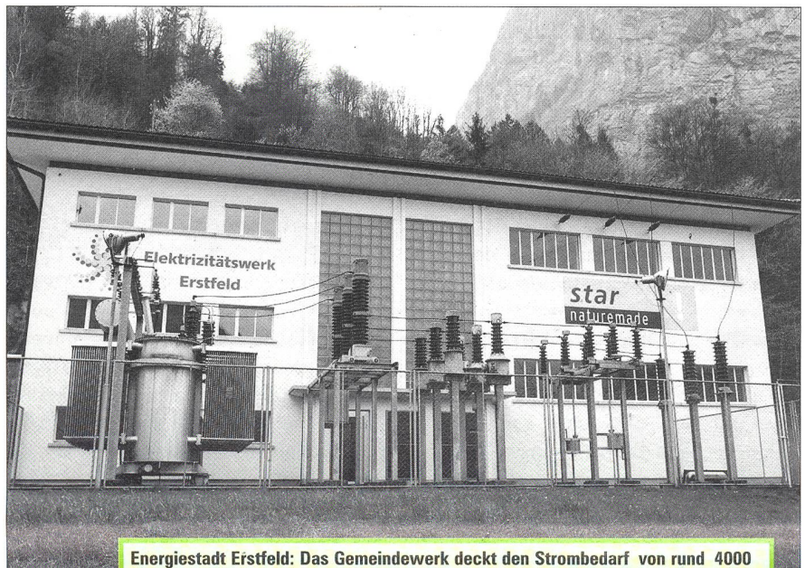
Energiestadt Erstfeld: Das Gemeindewerk deckt den Strombedarf von rund 4000 Einwohnern zu 70% mit naturemade-star-zertifiziertem Ökostrom.

Eine Untersuchung des WWF Schweiz zeigt: Nur in 16 Kantonen wird überhaupt Ökostrom produziert. Am meisten in Schaffhausen und Bern.