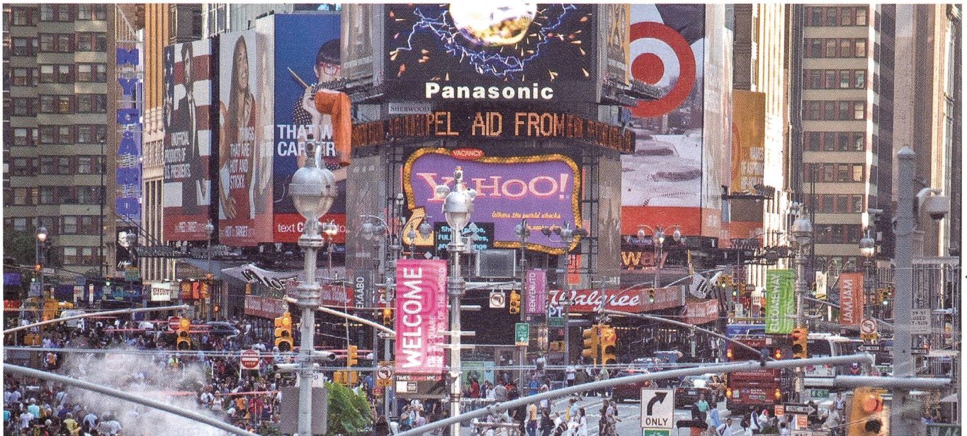
Die Rechnung ist einfach: Es gibt mehr Menschen als Ressourcen. Wird die Grenze der ökologischen Tragfähigkeit überschritten, so kommt es zum Kollaps. Energie spielt dabei eine wichtige Rolle, da die meisten Ressourcen in absehbarer Zukunft ausgehen.

Ausgehend von der 1972 erschienenen Publikation «Grenzen des Wachstums» wurde in den 1970er und 1980er Jahren in der westlich industrialisierten Welt sowohl in Politik, Wissenschaft und Medien eine zum Teil sehr kontroverse Wachstumsdebatte geführt. In den vergangenen 20 Jahren verlor das Thema zunehmend an Gewicht. Ausgelöst durch die momentane Finanz- und Wirtschaftskrise erleben wir eine kurze Renaissance dieser Debatte. Peak Oil und die Klimaerwärmung vor Augen, bleibt uns heute ein kurzes Zeitfenster, um die Wachstumsdebatte zu führen und das Ruder herumzureissen.