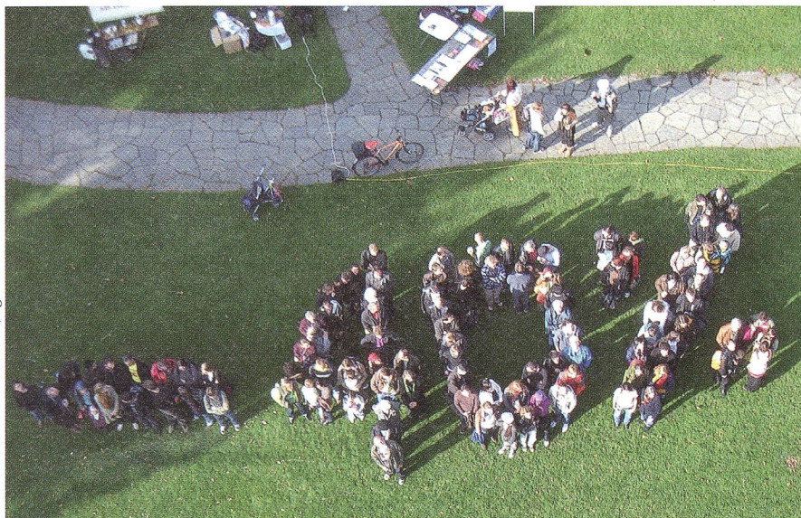
Eine der vielen Klima-Protestaktionen zu Kopenhagen: In Zürich forderten rund 350 Menschen, dass die Industrienationen ihre Treibhausgas-Emissionen bis 2020 um 40% reduzieren.