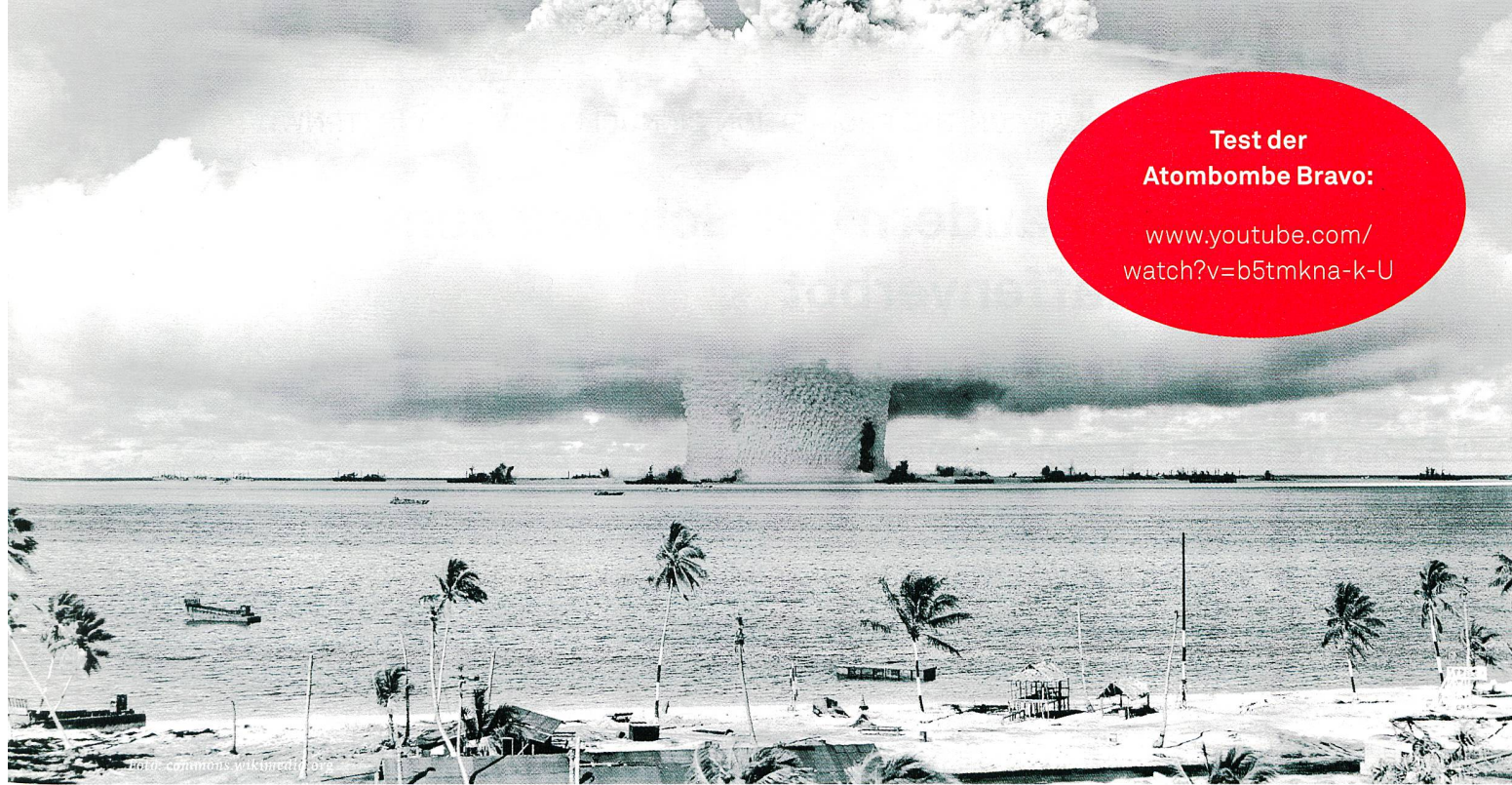
US-Atombombentests auf dem Bikini-Atoll: Die Wasserstoffbombe Bravo war die stärkste Bombe, die je gezündet wurde und entsprach etwa 1000 Hiroshimabomben. Neben Bikini wurden auch die bewohnten Atolle Rongelap und Rongerik durch radioaktiven Niederschlag kontaminiert (Bild oben: Explosion der Atombombe Baker; links: Atombombentest Romeo.)

dann enden wird, wenn ein militärisches Gleichgewicht wiederhergestellt ist». Shellenberger zitiert auch einen deutschen Akademiker, der argumentiert, dass ein mit Atomwaffen bewaffnetes Deutschland «die NATO und die Sicherheit der westlichen Welt stabilisieren würde». Aus seiner Sicht «sollten wir froh sein, dass Nordkorea die Bombe hat». Und so geht es weiter – seine Begeisterung für die Verbreitung von Atomwaffen kennt keine Grenzen.