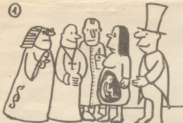
Schützt das Leben...

Die Kommunisten traten für die Freigabe der Abtreibung ein, während die Sozialdemokraten sich nicht zu einer einheitlichen Haltung im Interesse der Frauen und der Arbeiterfamilien durchringen konnten: Eine Minderheit unterstützte zwar ebenfalls die Forderung der Freigabe, aber die Mehrheit neigte zum Kompromiss, sie unterstützte die Indikationslösung, die auch die soziale Indikation miteinbeziehen sollte.