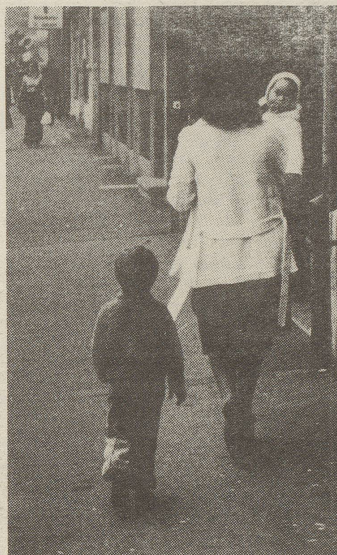
Morgens um halb sieben bringen die Mütter die Kinder in die Krippe.

Da es keinen pädagogischen Auftrag für Krippen gibt, werden Grundelemente der Kleinkindererziehung oft vernachlässigt. Mit den Kindern wird sehr selten gebastelt, obwohl dies zum Kennenlernen der Umwelt und zur Erprobung von verschiedenen Materialien von grosser Wichtigkeit ist. Auch das Erzählen wird vom Personal nicht sehr geschätzt. Bis 80% der Kinder in den Krippen sind Ausländerkinder. Gerade sie hätten es nötig, dass ihnen jemand in deutscher Sprache Geschichten erzählt, sie zum Fragen und Nachdenken animiert. Sprachliches Ausdrucksvermögen ist für den späteren Schulerfolg von entscheidender Bedeutung. Einrichtungen, die in jedem Kindergarten selbstverständlich sind, wie z.B. Kasperlietheater, Musikinstrumente und Konstruktionsspiele fehlen in den meisten Krippen. Anstatt die Kinder sinnvoll zu beschäftigen und in abwechslungsreichen Spielen ihr Können und ihre Phantasie zu fördern, werden sie einfach beaufsichtigt. Fehlverhalten werden mit Schlägen, Essensentzug und Isolierung (Keller, Estrich, Treppe) bestraft. Säuglingen verabreicht man Beruhigungssirrup, wenn sie zu lange und zu laut weinen oder man legt sie in