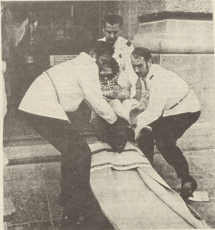
Die Invalide wird abtransportiert

Mitte Juni sass die invalide Sechzigjährige auf der Bundeshaustreppe und verteilte den Vorübergehenden einen hektographierten Brief an den "Sehr geehrten Herren Bundesrat Hürlimann". Ein Bundeshauskorrespondent beobachtete, wie ein Polizist ihr die Briefe aus der Hand riss und wie nachher drei Sanitätspolizisten die Frau abschleppten. Die Frau wohnt in Zürich. "Mein Name tut nichts zur Sache, ich will weder Mitleid noch Publizität, ich will nur eine gerechte AHV für meine Mitschwestern und mich." Es geht um die Benachteiligung der ledigen Frau, "dem schwächsten Glied unter den Rentnern", "Eine verheiratete Frau kann 20 Jahre jünger sein als ihr Mann, dann kriegt sie schon mit 45 Jahren eine Zusatzrente. Ist die Frau aber 10 Jahre älter als ihr Mann, erhält sie, auch wenn sie keine Beiträge an die AHV bezahlt hat, eine einfache Altersrente. Ihr Mann bringt den vollen Zahltag nach Hause, und bis der Mann das Rentenalter erreicht hat, hat die Frau von der AHV bereits Fr. 78 000 erhalten.... Die Männer verdienen im Durchschnitt 50 % mehr Lohn als die Frauen... Den Witwen wird eine Rente ausbezahlt nach den Beiträgen der Männer, also mehr als der ledigen Frau. Eine Witwe kann zudem schon ab 45 Jahren ohne eigene Beiträge eine höhere Rente beziehen als ich je bekommen werde. Ist sie gut situiert und hat es nicht nötig zu arbeiten, muss sie auch weiterhin keine Beiträge bezahlen, während ich mit meiner kärglichen IV-Rente noch einen Obolus abgeben muss." Und dann