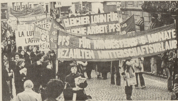
Frauen der Progressiven Frauen Schweiz (PFS) an der Demonstration zum 8. März in Zürich.

Die kantonalzürcherische Volksinitiative der POCH für die Schaffung von Kindertagesstätten erhielt 69'362 JA-Stimmen gegenüber 221'278 NEIN. In der Stadt Zürich legte jeder dritte Stimmentein Ja in die Urne. Sieben Parteien hatten die Nein-Parole herausgegeben, drei Parteien empfahlen JA: SP, PdA und POCH. Der Aufruf des Unterstützungskomitees wurde von den Redaktionen der grossen Tageszeitungen unterschlagen, obgleich darin immerhin 11 Kantonsräte (SP/POCH) vertreten waren, 5 Zürcher Gemeinderäte, Nationalrätin Lilian Uchtenhagen und zahlreiche Frauen und Männer aus Erziehung, Kultur, Wissenschaft und verschiedenen Berufen. (vgl. "Emanzipation Nr. 3) Ueberhaupt wurde die Kampagne von den Gegnern der KITA-Initiative äusserst demagogisch geführt. Das Bürgertum führte seine reaktionärste Familien-