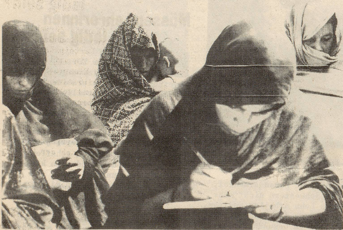
Schulung: Wichtiger Schritt zur Verwirklichung der Gleichberechtigung

Immerhin sind bereits bis heute zwei wichtige Schritte in dieser Richtung unternommen worden: Das Polygamie-Verbot (die Saharaische Republik ist eines der ersten arabischen Länder, die diesen wichtigen Faktor der Befreiung der Frau erfüllt haben) und die Schulung. A0