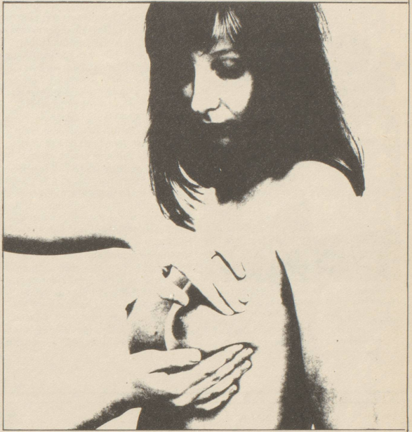
Die Brustuntersuchung kann man selber machen. Ihr Arzt soll Ihnen zeigen wie!

Viele Frauen, die den Fragebogen ausgefüllt haben, negieren Verhütungsmittel, in den meisten Fällen die Pille. Selten informieren die Frauenärzte