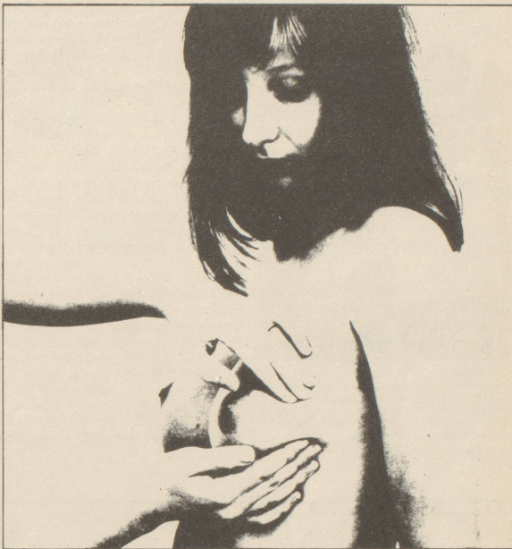
Die Brustuntersuchung kann man selber machen. Ihr Arzt soll Ihnen zeigen wie!

Viele Frauen, die den Fragebogen ausgefüllt haben, negieren Verhütungsmittel, in den meisten Fällen die Pille. Selten informieren die Frauenärzte