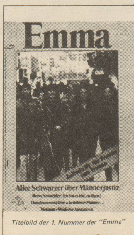
Titelbild der 1. Nummer der "Emma"